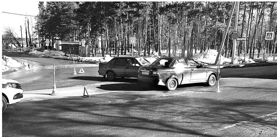
• Нарушение правил очередности проезда перекрёстка – одна из причин частых дорожно-транспортных происшествий.

С начала года по вине пешеходов произошло лишь одно ДТП, в котором пострадал один человек. На конец марта прошлого года было зафиксировано пять аналогичных происшествий, в которых пострадали два человека и трое погибли. Кроме того, с начала года было зафиксировано лишь одно дорожно-транспортное происшествие с участием несовершенно-