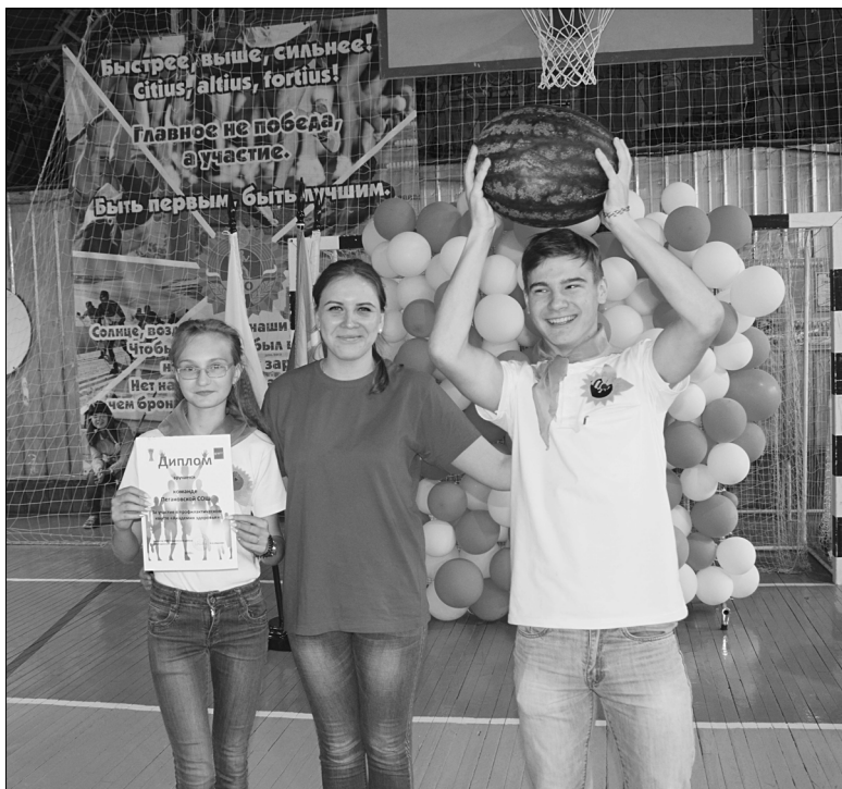
Активисты из Пеганово были награждены дипломом и сладким подарком.

На центральном стадионе состоялся традиционный фестиваль-закрытие «Трудовое лето – 2019».