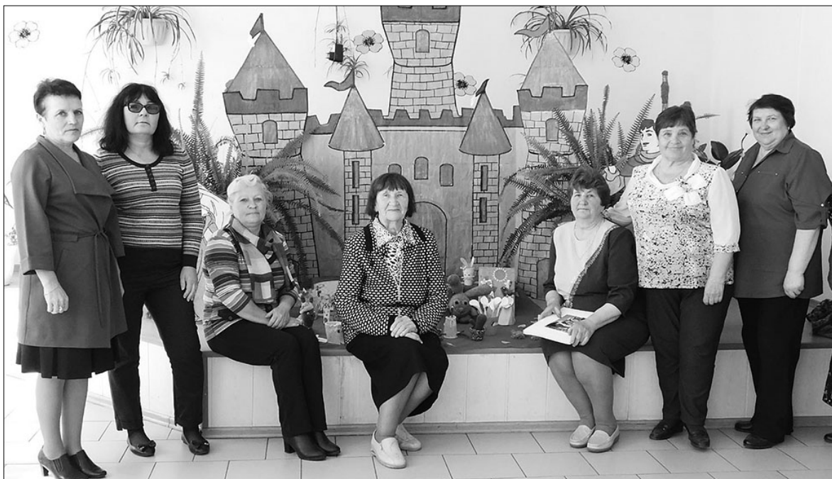
«Встреча прошла в теплой и уютной обстановке. Спасибо зарословцам за радушный прием», - говорят участники мероприятия.