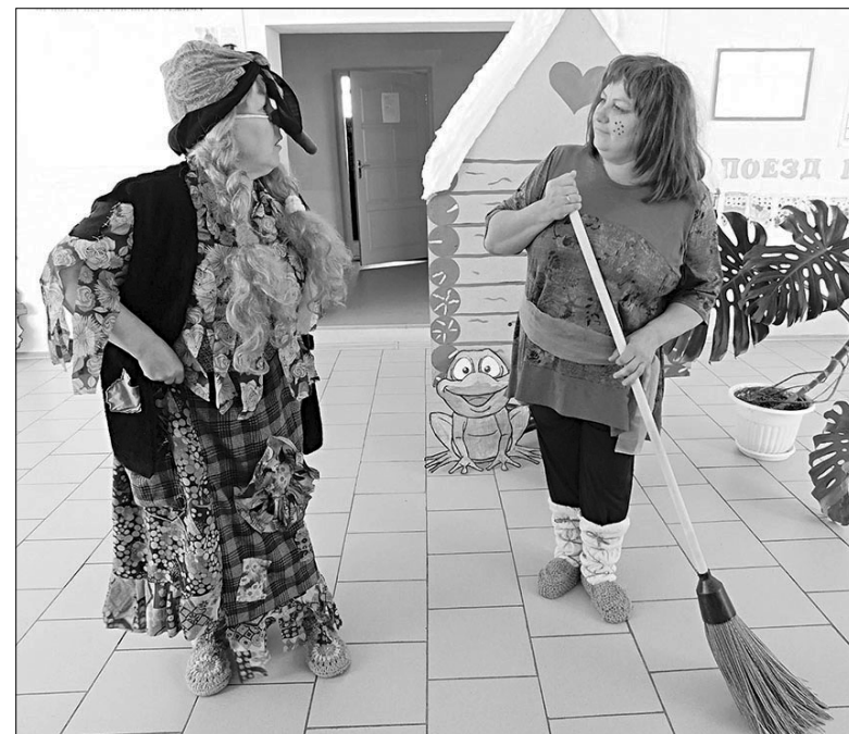
Небольшим мини-спектаклем встретили поэтов в сельском Доме культуры.

Какое сейчас и каким было в прошлом? Оно было разным: Быть может, с горчинкой. Счастливым, прекрасным, И чуть со слезинкой... Оно пробуждало