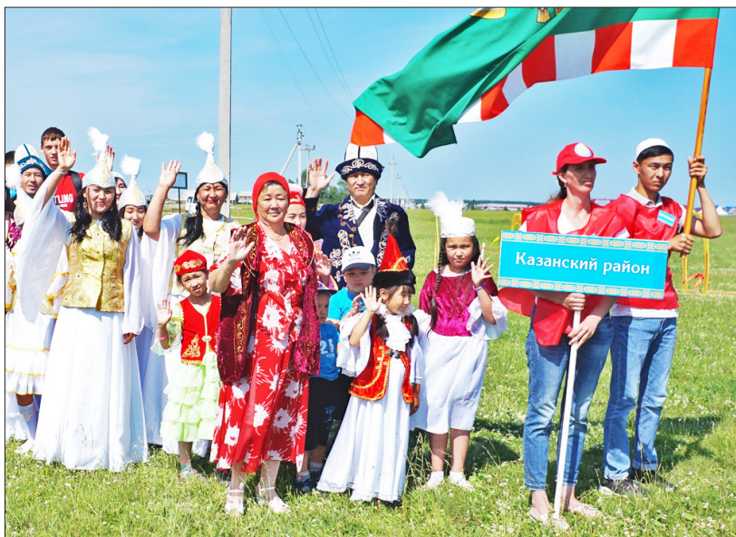
Делегация Казанского района на празднике Курултай в Голышманово (2018 год), занявшая 1 место в спортивных состязаниях и в конкурсе «Подворье»

Курултай давно стал любимым праздником не только для казахов, но и для всех жителей области. Для его участников проводятся конкурсы и спортивные состязания. Представители делегаций показывают национальные костюмы и обряды, демонстрируют убранство юрты и блюда традиционной кухни.