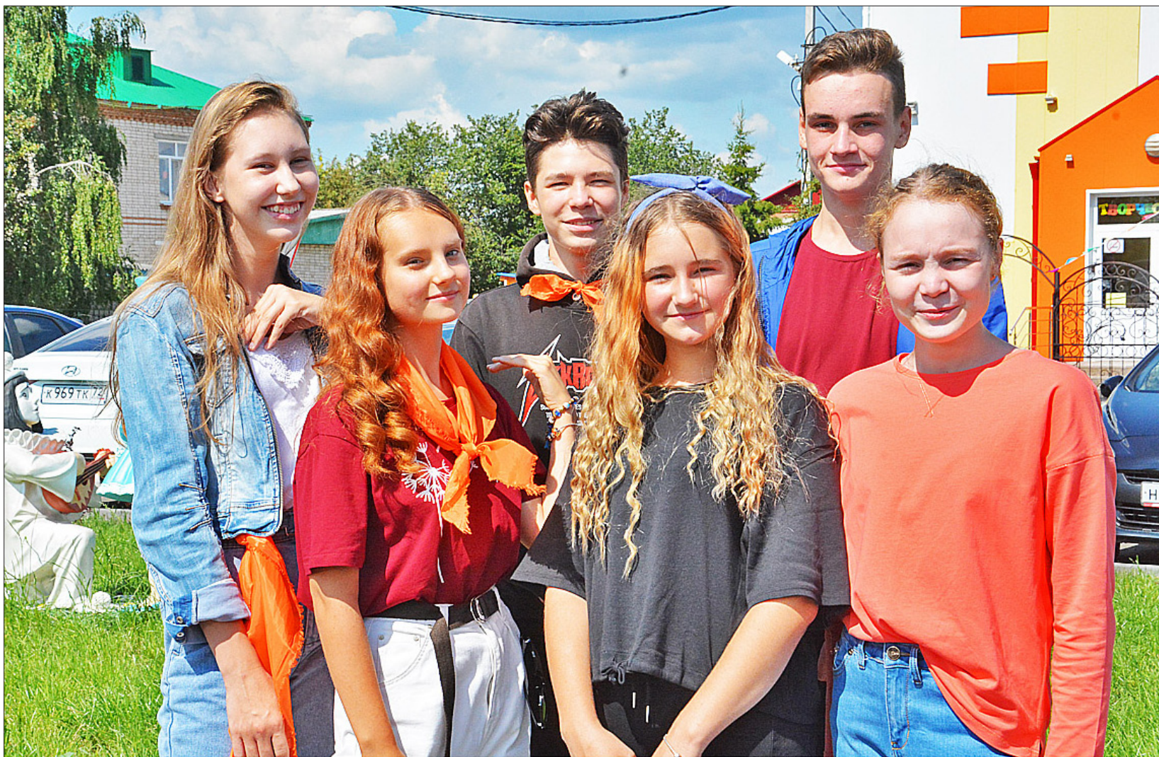
Лето – самая прекрасная пора. В этом уверены воспитанники детской школы искусств

На прошлой неделе в Казанской детской школе искусств открылся лагерь дневного пребывания «Творческая школа»