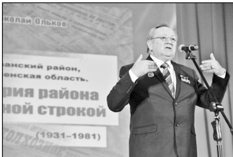
Автор книг по истории района ещё и талантливый оратор

Критикуют всё и всех, не опасаясь последствий. Я неплохо знал районную печать юга области в ту пору, но я не знал другой такой газеты, которая была столь свободна и абсолютно независима. <...> Казанке повезло делать и читать настоящую газету!»