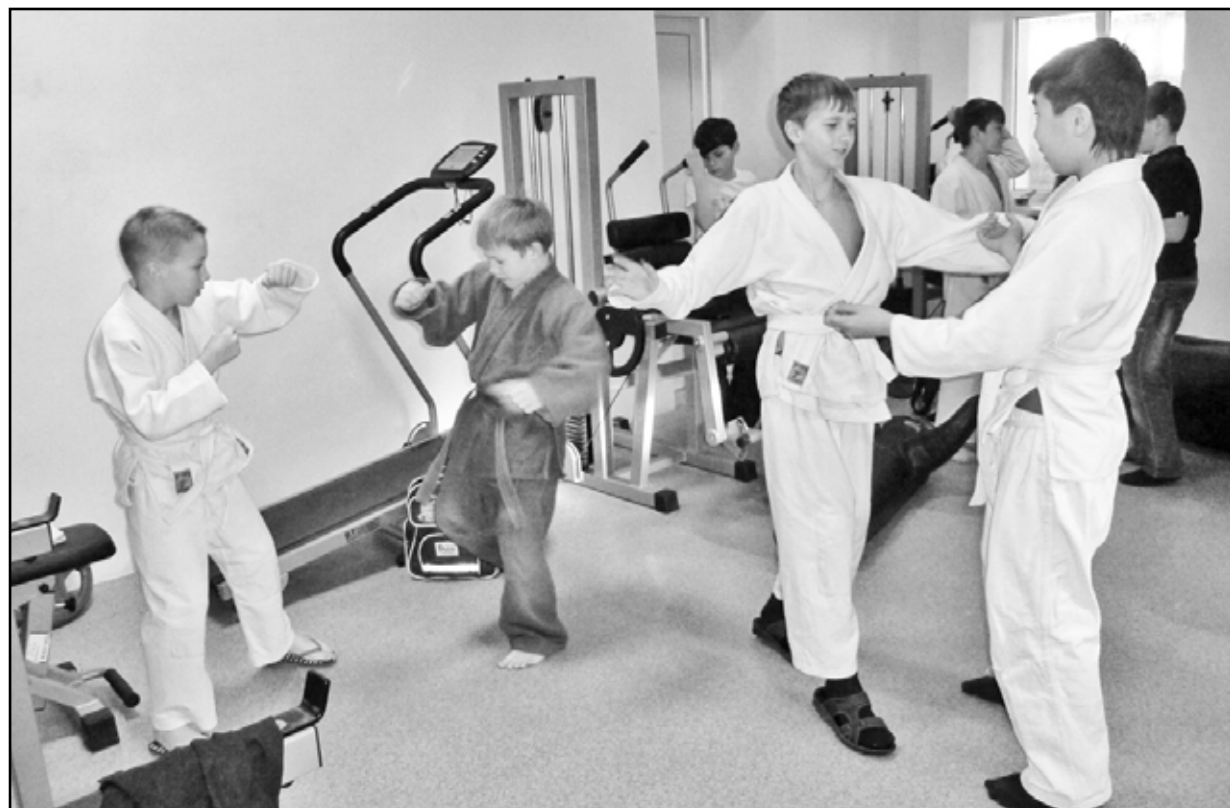
Как поработаешь на тренировке, так и выступишь на соревнованиях