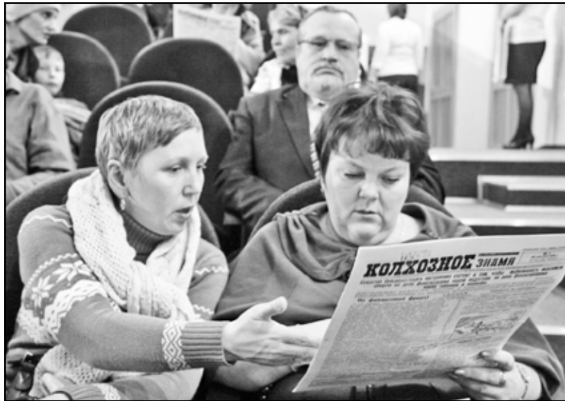
Первый номер «Колхозного знамени» вызвал общий интерес