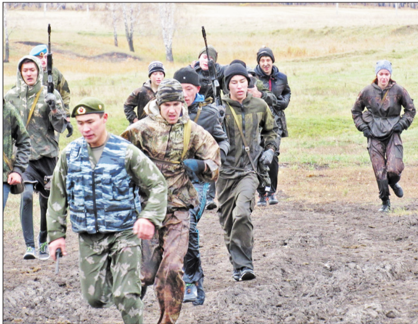
Бегом – к победе