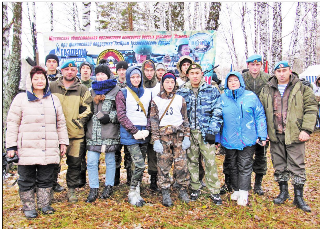
Состав команды перед испытанием