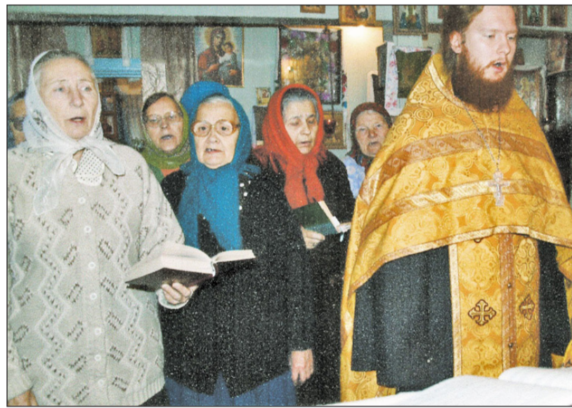
Богослужение в день Казанской иконы Божией Матери в домовом храме с. Казанского. 4 ноября 2007 г.

ский называет жизнь не театром, а... блаженством! И, вместе с тем, — великой тайной Божьей. «Жизнь есть блаженство. Эти слова могут показаться странными. Как можно жизнь назвать блаженством, если в ней на каждом шагу встречаются неудачи, разочарования, огорчения. Сколько горя терпят люди! Жизнь, говорят некоторые, есть труд, и часто труд неблагодарный, какое уж тут блаженство? Блаженством для нас станет жизнь тогда, когда мы научимся исполнять заповеди Христовы и любить Христа. Тогда радостно будет жить, радостно терпеть находящиеся скорби, а впереди нас будет сиять светом Солнце Правды — Господь, к которому мы устремляемся. Все Евангельские заповеди начинаются словом «блаженны»: блаженны кроткие... блаженны милостивые... блаженны миротворцы... (Мф. 5, 5, 7, 9). Отсюда вытекает как истина, что исполнение запо-