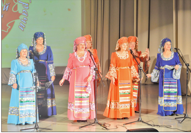
Зрители по достоинству оценили выступление группы «Россияночка» Грачёвского дома культуры

— В этом году мы не стали устраивать конкурс, а просто пригласили наших неунывающих ветеранов, которые всегда молоды душой, поучаствовать в праздничной программе и порадовать земляков своими яркими талантами, раскрыть свой внутренний мир, — рассказа-