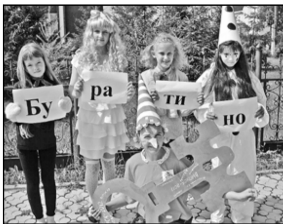
Команда Большеченчерской школы после выступления