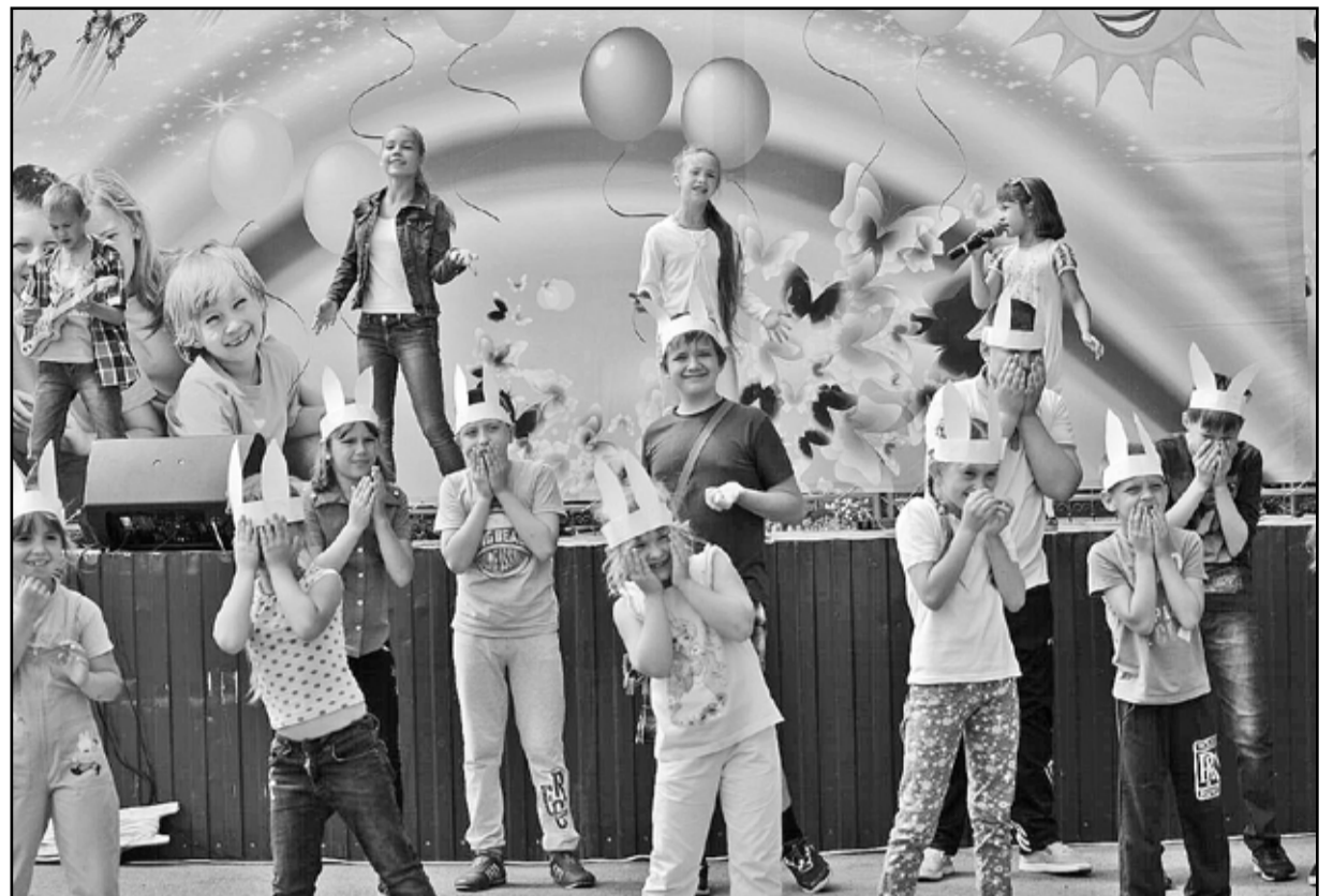
Труппа «Бриллиантовая рука» из Казанской школы оказалась самой многочисленной

Зрители в это время тоже не скучали. Пока команды вы-