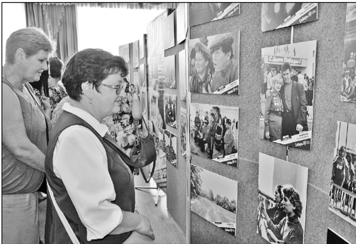
Выставка вызвала живой интерес