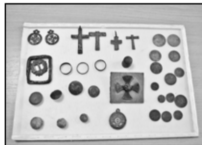
Предметы, переданные В. Барановым в дар районному краеведческому музею