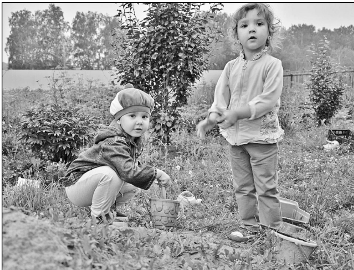
В огороде столько дел!