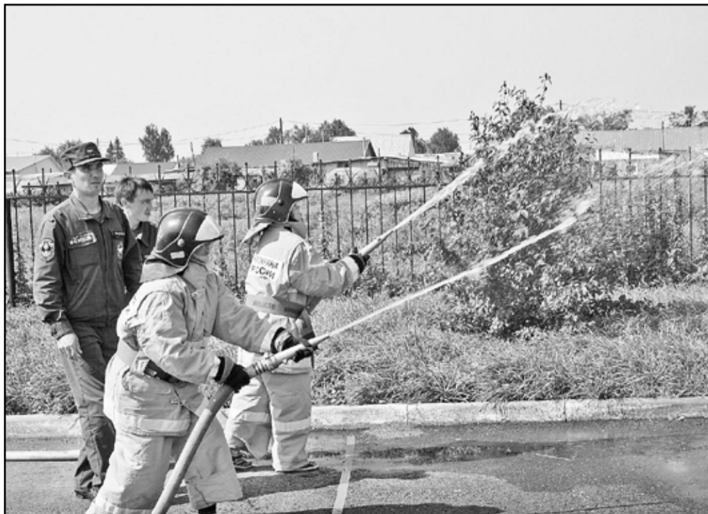
Каски, форма и вода – всё настоящее

Основные состязания проходили в рамках эстафеты в несколько этапов: одевание боевой одежды – настоящей экипировки пожарного, преодоление препятствия «забор», затем следовал этап «тоннель», и наиболее интересным для детей стал этап «сбивание цели с помощью подачи ствола». Предлагалось сбить струёй воды из ручного пожарно-