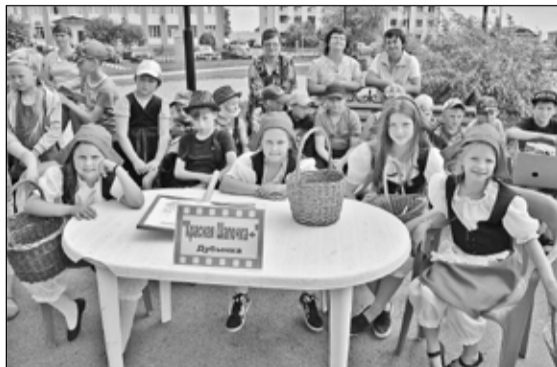
Команда «Красная шапочка» из Дубынки