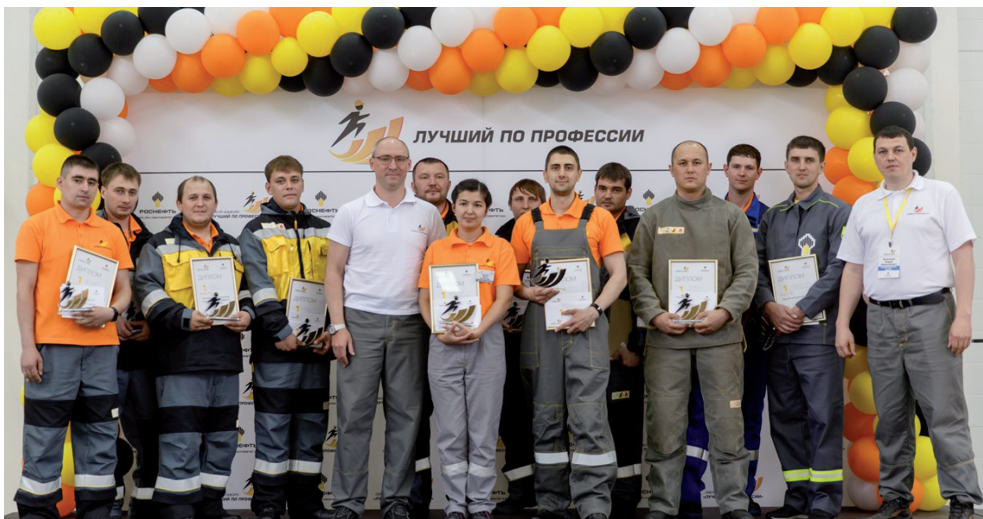
Победители семнадцатого смотра-конкурса «Лучший по профессии-2019» ООО «РН-Уватнефтегаз».