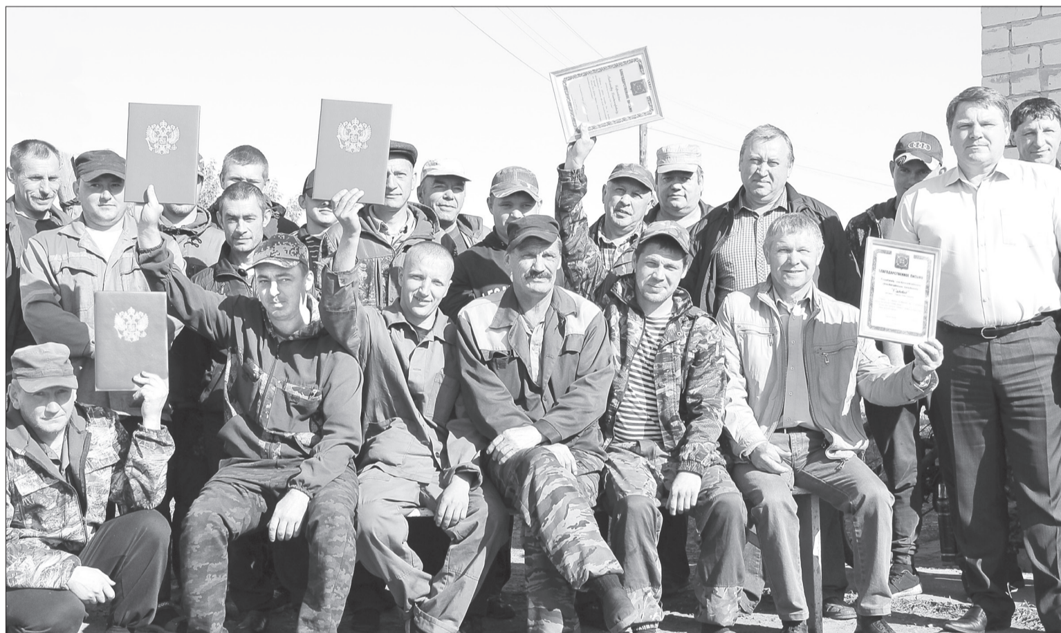
Среди хозяйств Ялуторовского района СПК «Садовод» ежегодно лидирует в полевых работах

В Прогрессе вчера наградили участников страды