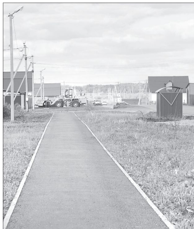
На улицах Восточного микрорайона приводят в порядок проезжие части, кюветы и организуют подъезды к домам