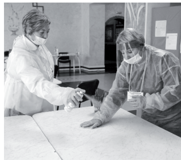
В единый день голосования, в воскресный график дел ишимцы включили и поход на избирательные участки. Тем самым они проявили гражданскую позицию и сказали слово в поддержку своего депутата в городскую думу.

двенадцатый год. «Комиссия достаточно опытная, – подчёркивает она. – Перед каждым выборами проходим обучение, все ситуации разрешаем в рамках законодательства Российской Федерации».