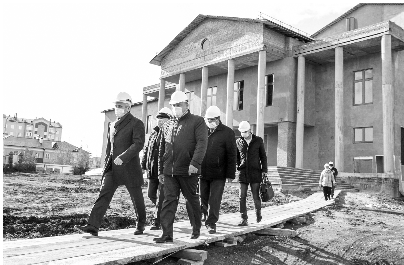
Техническая готовность центра культурного развития – 65 %, сдача объекта запланирована на четвертый квартал 2021 года, но подрядчик – АО «Ишимагросстрой» – обещает завершить строительство досрочно. // Фото Василия БАРАНОВА.

– Ишим давно заслуживает такого досугового центра: в городе насыщенная культурная жизнь, благодарные зрители, сюда