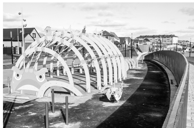
Три зоны бульвара Белоусова, предназначенные для тихого, активного и детского отдыха, связаны между собой общим пешеходным маршрутом и перетекают одна в другую.