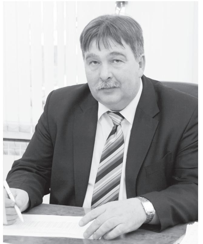
По мнению Сергея Максимова, работники агропромышленного комплекса района в этом году справились с поставленными задачами.