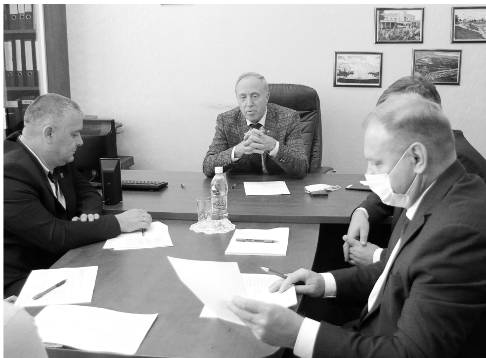
Прием граждан прошел в новом формате — по телефону. В кабинете с депутатом находились только заместители главы Ишима.