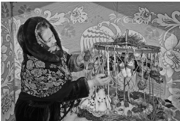
➤ Сувениры из Сартамского сельского поселения