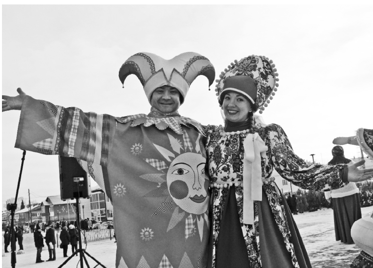
➤ Работники культуры