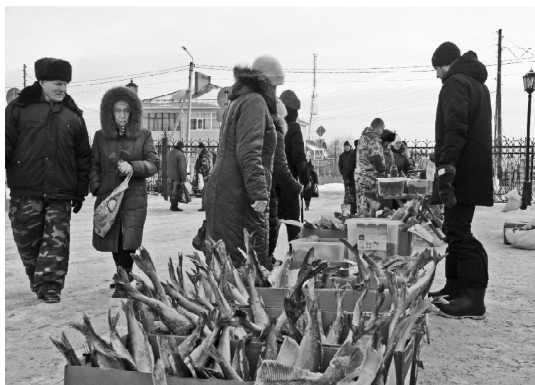
➤ Рыба на любой вкус