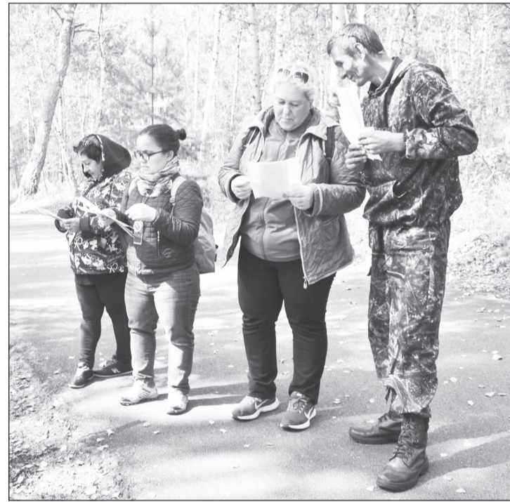
Участники на тропе изучают карту.

Первого сентября на территории Биатлонного центра прошёл юбилейный, уже 10-й по счёту, чемпионат и первенство Упоровского района по спортивному ориентированию по тропам (trail-o).