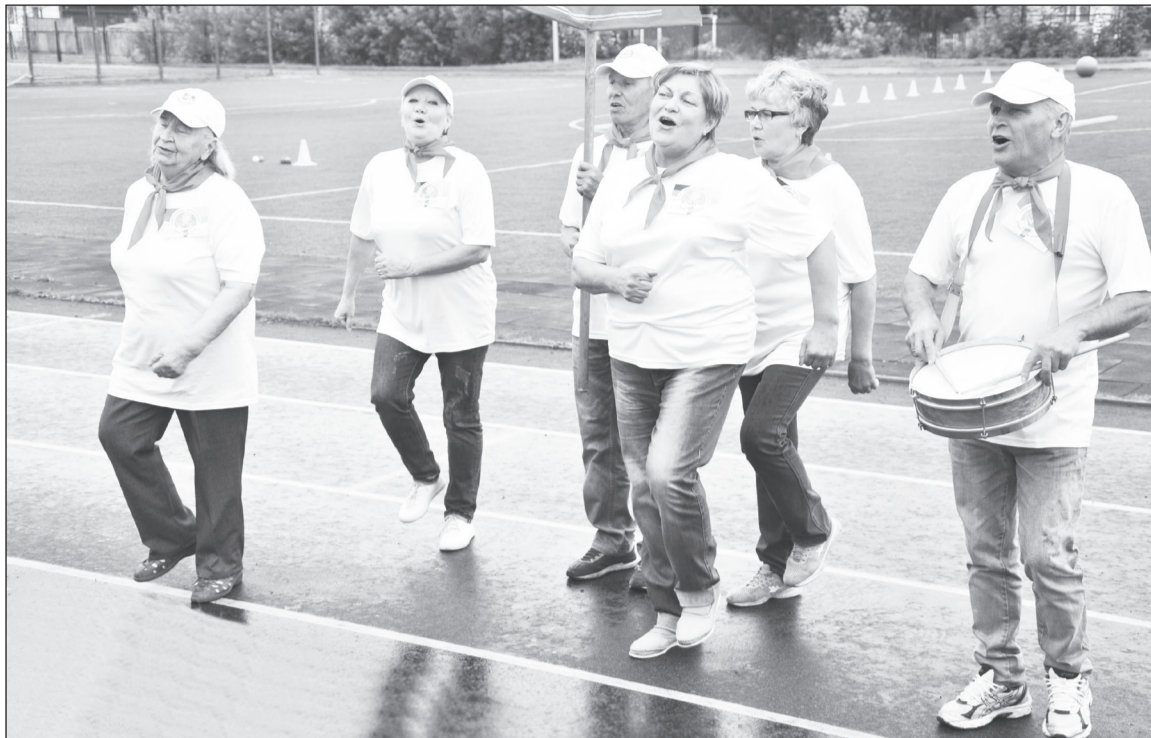
Бывшие пионеры Емуртлы и сегодня руководствуются принципом «Всегда готов!».