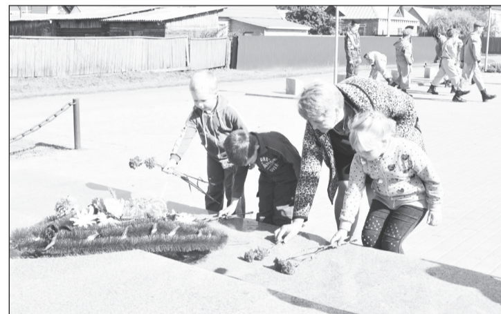
Воспитанники детского сада возложили живые цветы к обелиску Славы.

В России 3 сентября памятная скорбная дата. Она связана с драматическими событиями 2004 года, когда в результате террористического акта погибли 334 человека, из них 186 – детей. Трагедия, произошедшая в городе Беслане Республики Северная Осетия – Алания, потрясла весь мир и до сих пор отдаётся эхом боли и страдания в наших сердцах.