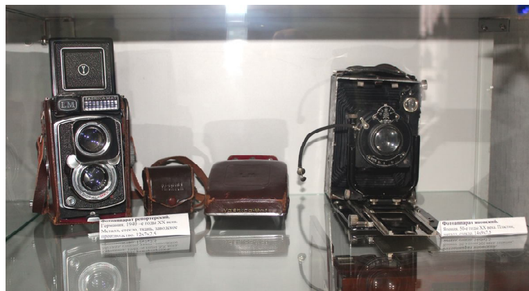
Слева-направо: фотоаппарат репортерский, 40-е годы, фотоаппарат японский, 50-е годы