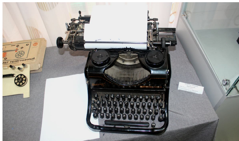
Механическая пишущая машинка, XX век