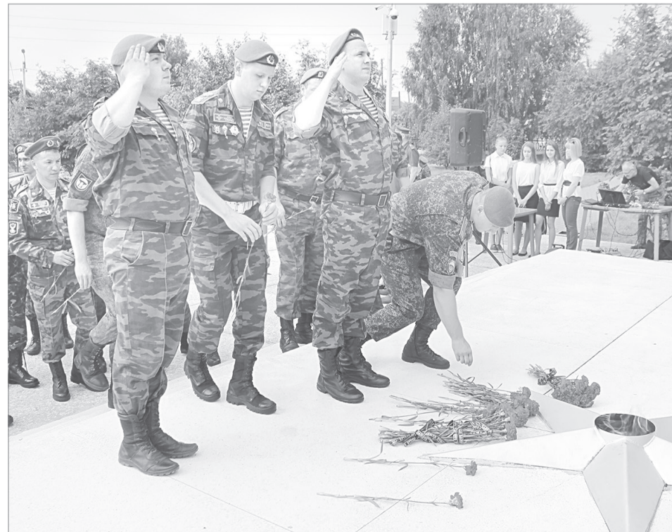
Цветы у вечного огня - дань памяти погибшим бойцам