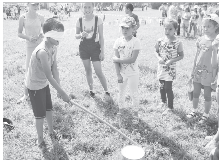
Попасть палкой по ведру с завязанными глазами да после того, как «раскрутили» вокруг своей оси - не так-то просто

Накануне подобные праздники прошли в Ревде и Центре национальных культур.