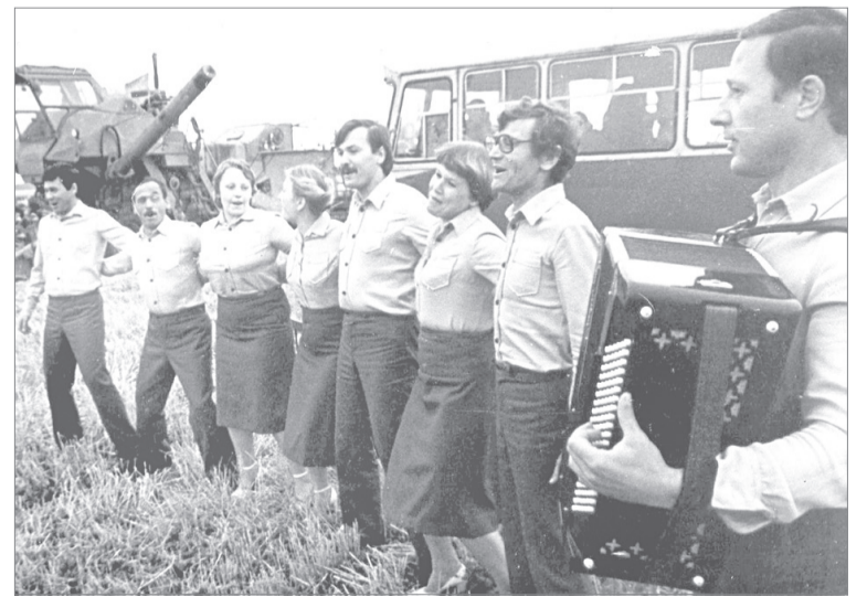
Агитбригада «Непоседы» городского ДК на полевом стане - начало 80-х годов

Обеденный перерыв короток, и вот уже механизаторы поднимаются и расходятся по машинам и агрегатам. Они чуток отдохнули, покушали, получили немало полезной информации, но, главное, подняли настроение и со свежими силами отправились на свою «передовую» - покормить бескрайние поля с поспевшим урожаем зерновых и других культур. Воистину, как пел Леонид Утёсов: «Нам песня строить и жить помогает, она, как друг и зовёт, и ведёт...». Так и в нашу бытность, с песней лучше спорится любая работа. Кстати, практика выезда агитбригад есть и ныне. Ждите материал о их работе в ближайших номерах газеты.