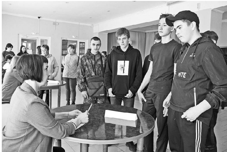
➤ На ярмарке рабочих мест

Накануне старта трудового лета в Викуловском районе специалисты центра занятости населения организовали ярмарку вакансий рабочих мест для несовершеннолетних. Подростки заинтересовались предложением пообщаться с работодателями, чтобы подыскать для себя временное занятие. При приёме на работу главное к ним требование – желание трудиться. А необходимые навыки они приобретают в процессе труда.