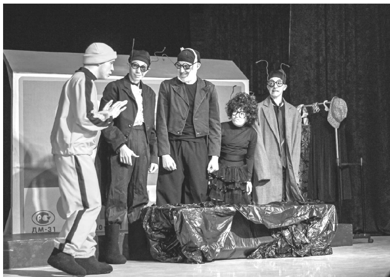
➤ Моменты спектакля // Фото Ксении ИВАНОВОЙ