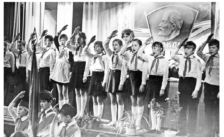
➤ Приветствие пионеров на отчётно-выборной комсомольской конференции