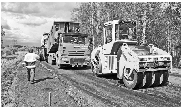
➤ На участке Абатское-Викулово