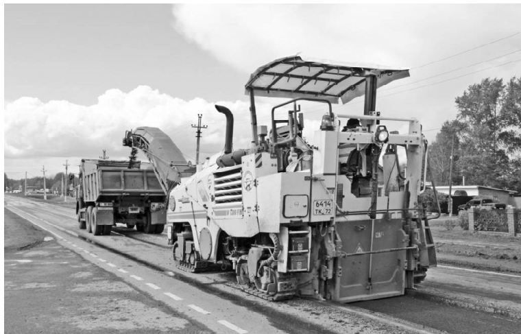
➤ На улице К. Маркса

С 11 мая работники ДРСУ-5 АО «ТОДЭП» приступили к ремонту дорожного полотна на улице Карла Маркса – это гостевая улица нашего районного центра. Протяжённость всего участка, подлежащего ремонту, – 1780 м. Разделили объект на три участка. Первый участок – от улицы Кузнецова до переулка Карла Маркса (585 метров) – уже отремонтирован. Если погода позволит, завершить ремонт всего объекта планируют к концу мая.