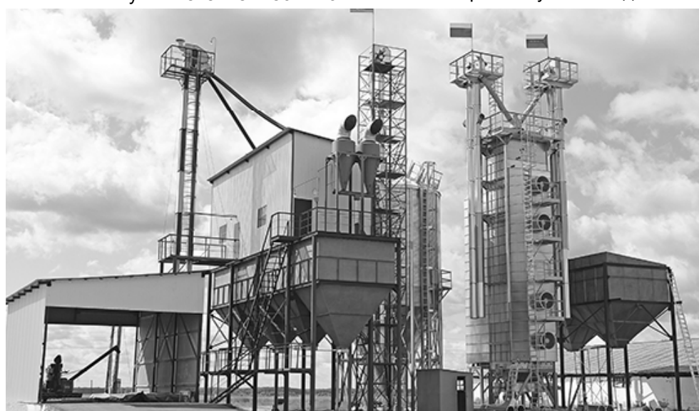
* Новый производственный объект