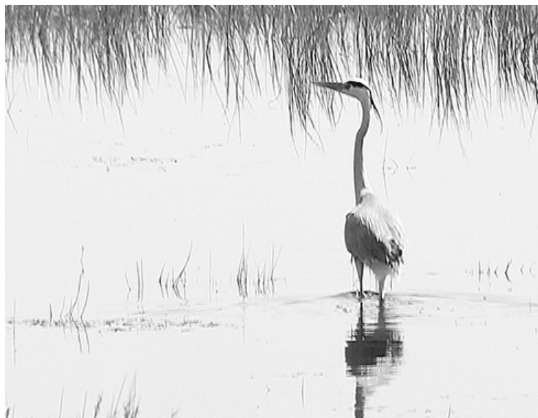
* В родных краях