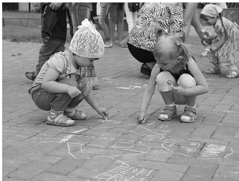
* «Рисуем маму...»