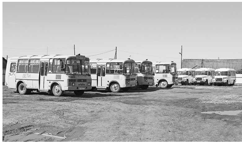
* Автобусный парк