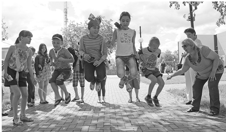
* Во время забав

Конечно же, начался праздник с весёлых детских забав. Под брызгами фонтана ребята самозабвенно ела сладкую вату, мальчишки и девчонки с удовольствием участвовали в конкурсах, собирали пазлы, плели косу из разноцветных бантов, крутили обруч, наблюдали, как из воздушных шариков в умелых руках рождаются красивые фигурки и букеты цветов, рисовали мелками на парковой брусчатке, сбивали кегли, прыгали на батуте. Одним словом, им было чем заняться всё это время!