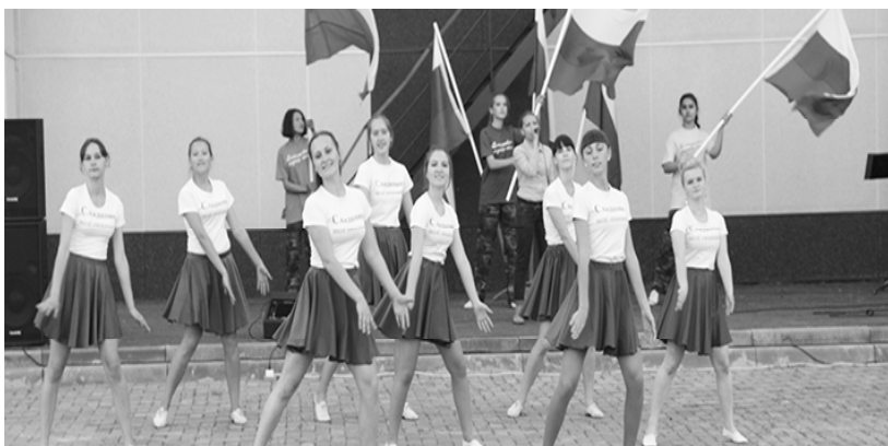
* Танцевальный номер