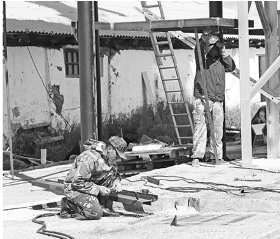
* Монтаж оборудования