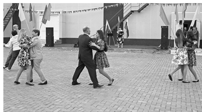
* «Закружились в танце...»

Искры яркого фейерверка взметнулись в вечернее небо над Сладковым. Под восторженные крики и аплодисменты собравшихся высоко «расцвели» букеты салюта, рассыпались в разные стороны огни, словно разбегались в траве светлячки. Всполохам вторили вспышки фотоаппаратов. Гости и жители села хотели запечатлеть на память зрелищность фейерверка, посвящённого Дню России, нашей великой страны!