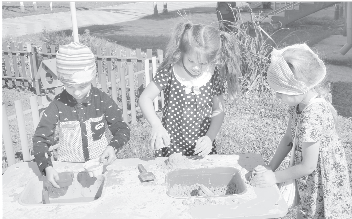
Маленькие «поварята» любят возиться с водой и песком

То, что в жизни пригодится. Чуть дальше по тротуару - перекрёсток автодорог. Здесь маленькие пешеходы и водители, пока ещё игрушечных машин, изучают правила дорожного движения и знаки. У ребят есть даже светоотражающий жилет инспектора и жезл. Гордость детсада «Колосок» - своя метеостанция, где ребятам в любое время года может наблюдать за погодой и природными явлениями, а также создавать свои первые исследовательские работы. В птичьей столовой с красивыми самодельными скворечниками от родителей юные натуралисты будут кормить пернатых гостей.