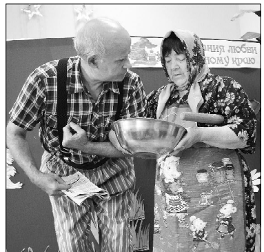
Сценка «Старуха и старик»