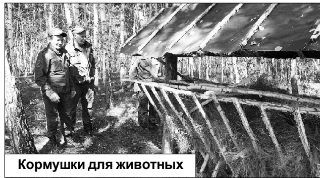
Кормушки для животных