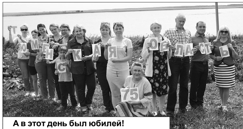
А в этот день был юбилей!