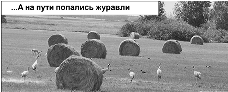
...А на пути попались журавли