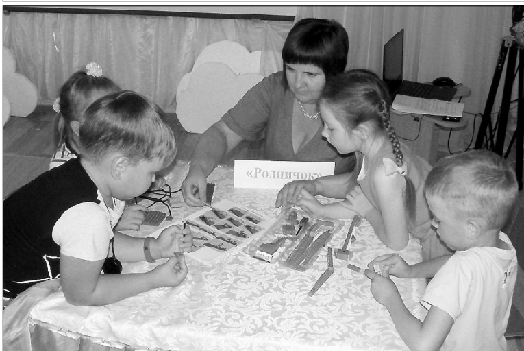
Ох, и трудная эта работа - легоконструирование