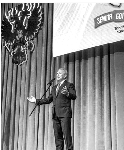
Губернатор области А.В. Моор

Тепло поздравили тюменцев с юбилеем региона губернаторы Ханты-Мансийского автономного округа-Югры и Ямало-Ненецкого автономного округа, поздравления звучали также от депутатов Тюменской областной Думы и законодательных собраний Ханты-Мансийского и Ямало-Ненецкого автономных округов, депутатов Государ-