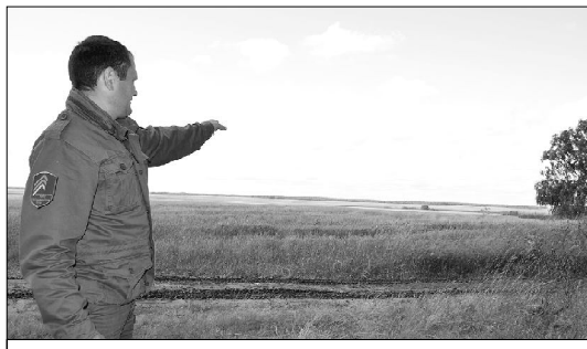
В том месте был замечен косолапый