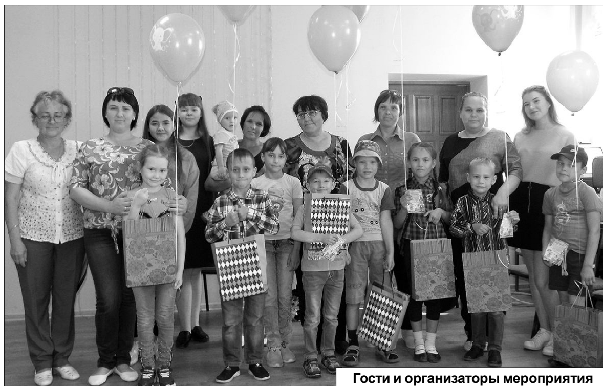
Гости и организаторы мероприятия