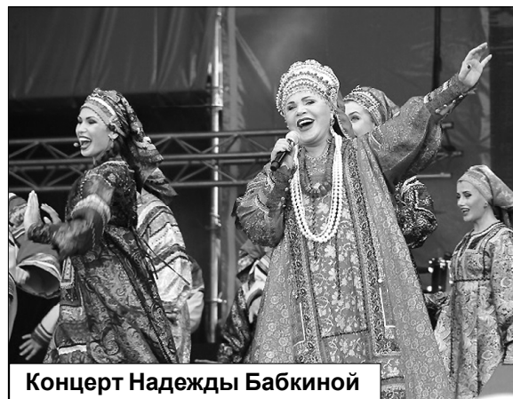
Концерт Надежды Бабкиной