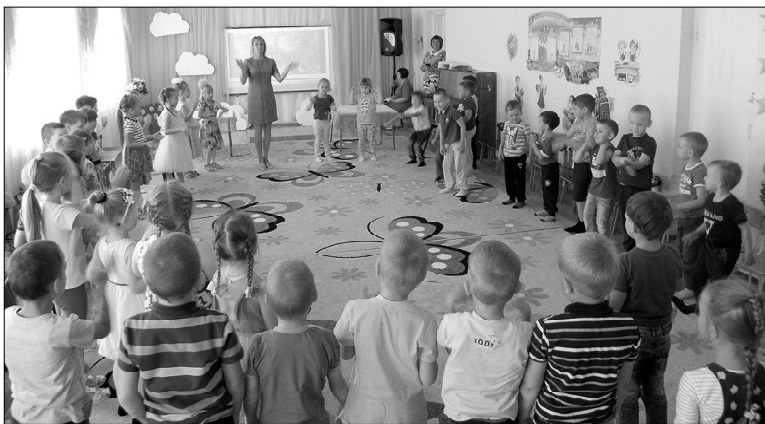
Дружно играли, вместе танцевали