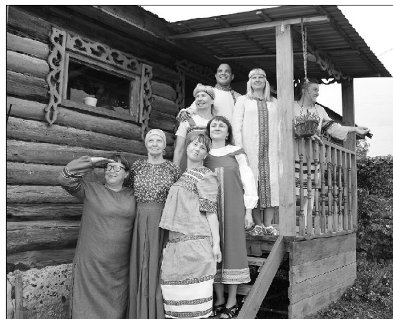
Стоим высоко, видим далеко

...Горница — самое большое и красивое место в любом деревенском доме, это и гостиная, и столовая, а заодно и спальня. На кроватях горкой теснятся пуховые подушки, на стенах — ковры ручной работы, на полу — домотканые половички. Скатерти, покрывала, салфетки и занавески украшены незамысловатыми кружевами и вышивкой. За каждой вещью кроется история, возможно даже человеческая судьба. Пришла в голову мысль — пластиковые окна здесь были бы совершенно неуместны.