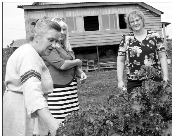
Знакомьтесь - это «Дамские кудри»

В этой семье давно теплилась идея создать уютный «ковчег» для приятного, полезного и познавательного отдыха. Присмотрели избышку, возраст которой перевалил за столетие. И уже на этапе проектирования и оснащения позаботились о комфорте гостей. Во внутреннем дворике оборудована «зона