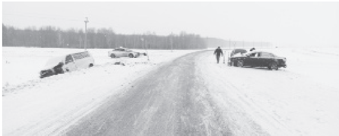
|| Фото ГИБДД

18 декабря «Toyota» и «Volkswagen» столкнулись на 115-м километре автодороги Шадринск-Ялуторовск. 47-летняя водитель «Toyota», жительница с.Исетское, была доставлена в больницу, где скончалась от тяжелейших травм. Ранены двое пассажи-