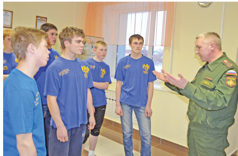
Военком о военной службе знает всё.

На год солдат на марше. Родине присяга В его душе незыблемо живёт, Как вечный свет единственного стяга, Ведущего вперёд, всегда вперёд!