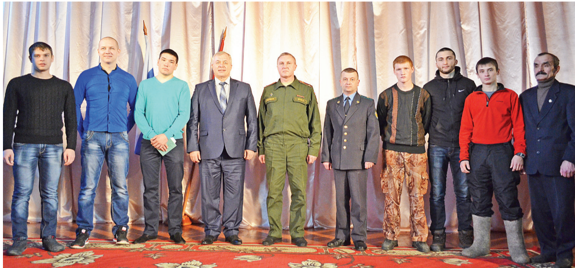
Это наши защитники!

Ребята, только что получившие аттестат о среднем образовании, рапортуя: «Так точно!»,