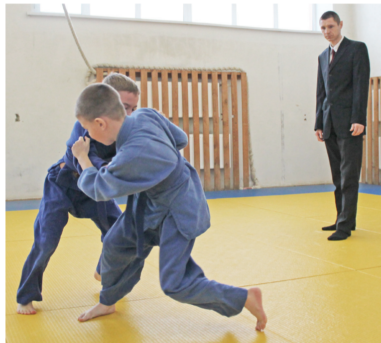
Ещё одна подсечка, и соперник будет повержен.

Любые соревнования – это не только праздник спорта, это ещё и радость встреч, общение и оздоровление. Сегодняшние соревнования подошли к концу.