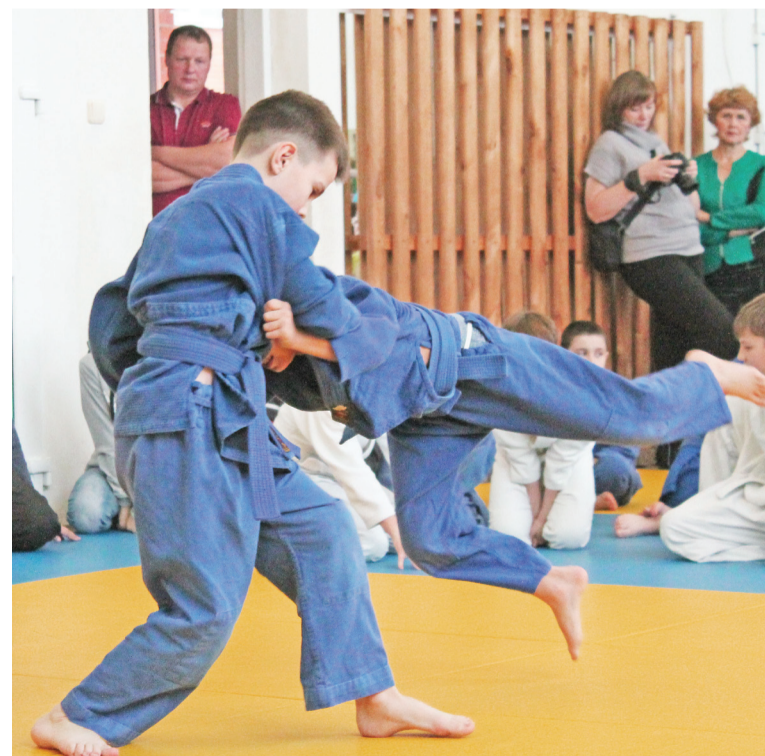
Вот так приёмчик!

Награды вручены, наставления тренеров выслушаны и взяты на заметку.