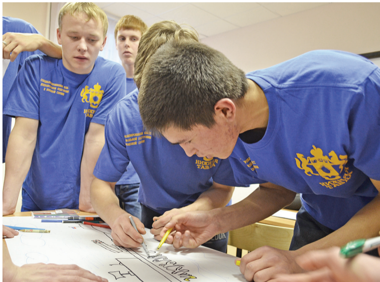
Быть лучшими в творческом конкурсе – задача команды.

«Никак нет!» Сразу виден шибановский парень! Я горд за таких призывников!