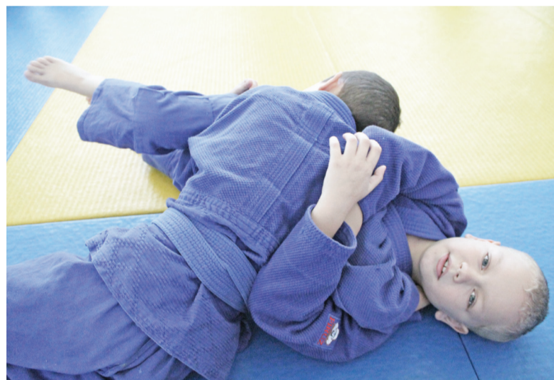
Ничего, шанс ещё есть, рано сдаваться!

один за другим, и лишь в упорной борьбе выявился победитель.