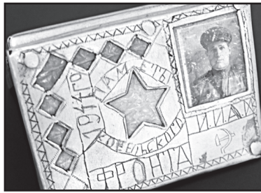
Самодельный алюминиевый портсигар Окончание. Нач. на 2 стр.

Подобные портсигары бойцы, как правило, изготавливали из алюминиевой обшивки сбитых самолётов. Надписи на портсигарах свидетельствуют о нежелании человека исчезнуть бесследно. Поэтому свои имена бойцы не только вкладывали в медалионы, но и процарапывали на личных вещах, сделанных из нетленных материалов. Такие надписи встречаются на орденах, ложках, расчёсках и на портсигарах.