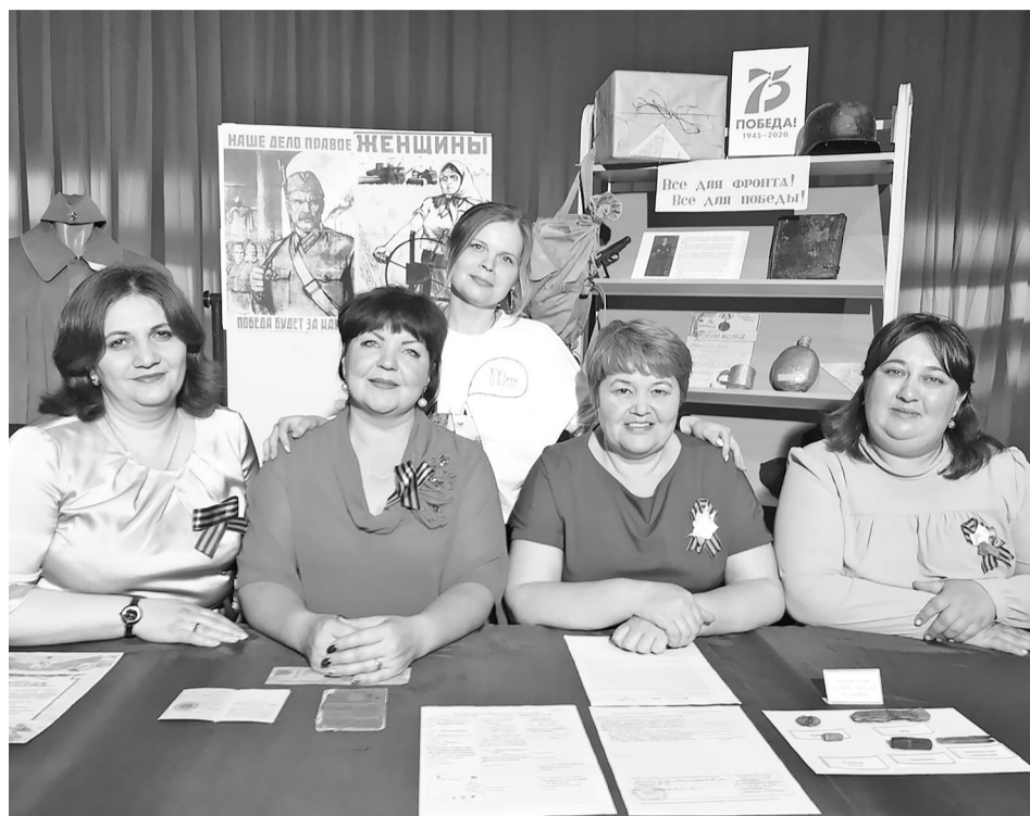
Коллектив Нижнетавдинского историко-краеведческого центра.

На прошедшей неделе произошёл пожар в частном секторе. В селе Велижаны загорелся нежилой дом, который был повреждён огнём по всей площади. Причина банальная и самая распространённая: короткое замыкание электропроводки. Намедни в деревне Вершина загорелся мусор на площади два квадратных метра. Лесных и ландшафтных пожаров не было, тем не менее, оперативный штаб по предупреждению стихийных бедствий усилил