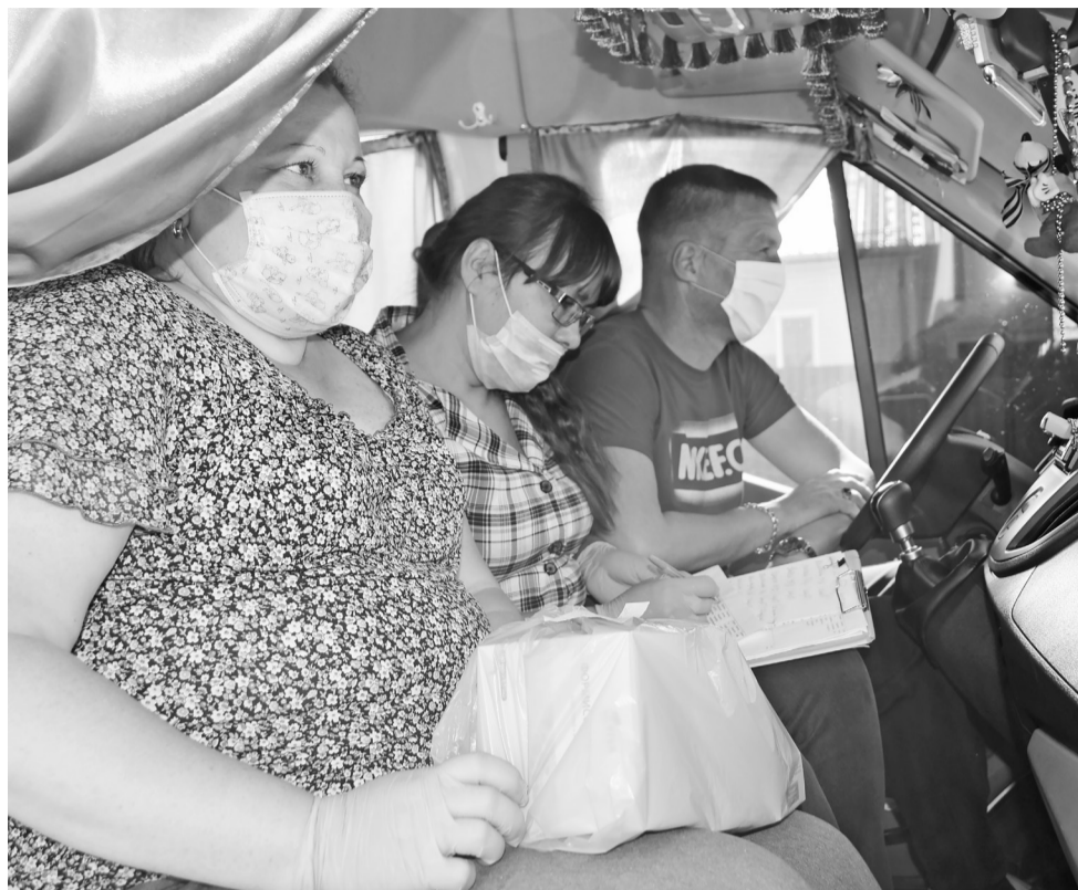
Первым делом бригада скорой социальной помощи забирает медикаменты в аптечном пункте, после чего строится маршрут и начинается движение.

Нижнетавдинцы получают льготные медикаменты не выходя из дома