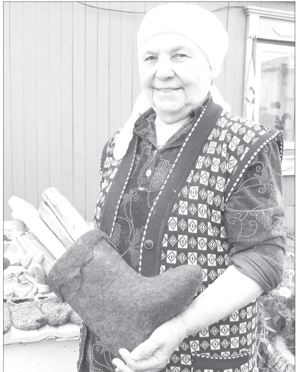
После насадки валенка на колодки остаются сушка и косметическая обработка

➤ Мастерица часто украшает валенки шерстяными цветами, фигурками птиц, узорами и пушистыми оборками