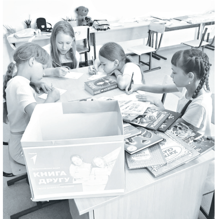
Бызовские школьники поучаствовали в акции дарения книг детям Донбасса.