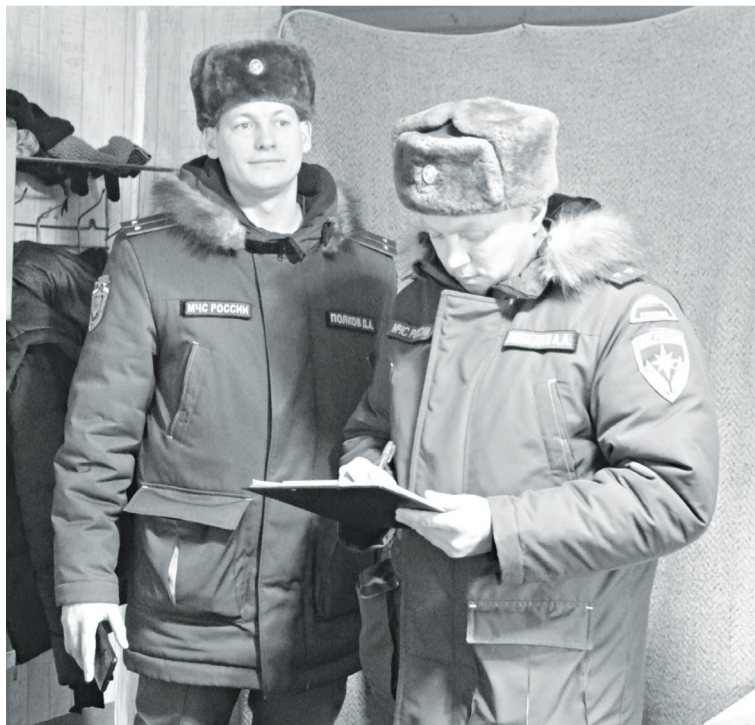
Сотрудники ведомства МЧС составляют чек-лист соблюдения Правил пожарной безопасности.