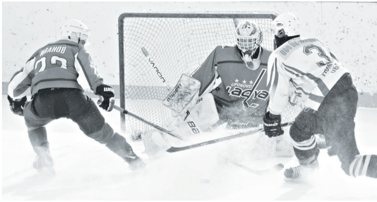
Упоровские хоккеисты отразили очередное нападение противника.

Прошедшая неделя стала во многом решающей для упоровских хоккеистов. Состоялось две игры: одна в пятницу в рамках чемпионата района, другая – в воскресенье, в рамках чемпионата области.