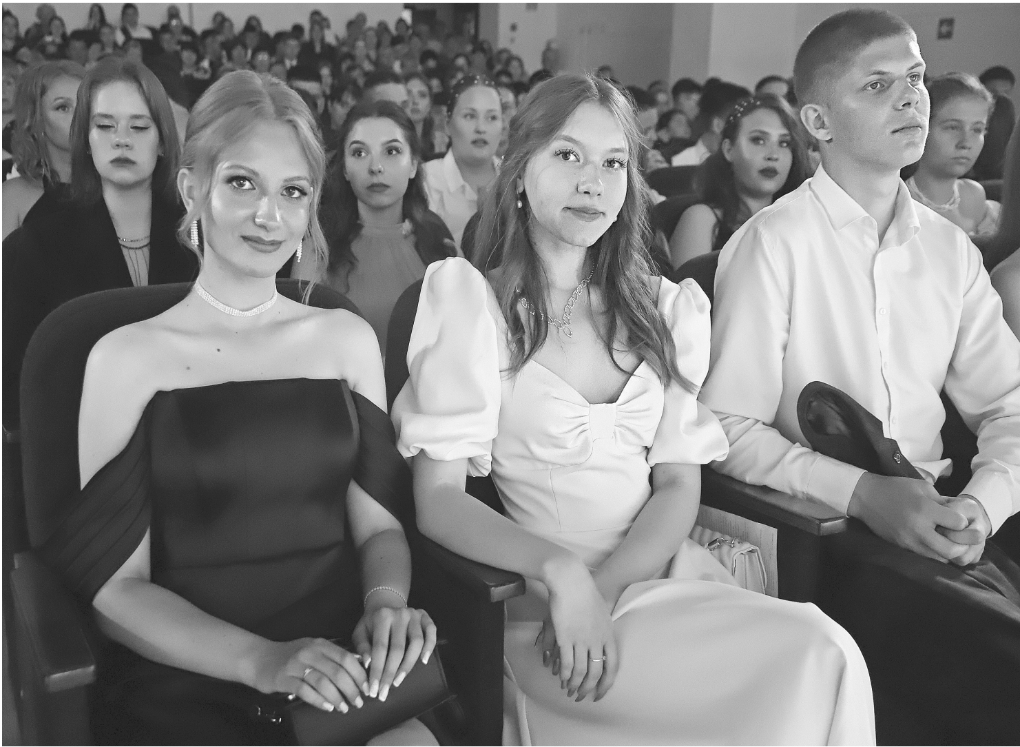
Школьное образование подготовило выпускников к тому, что ждёт их впереди

ЕСТЬ НОВОСТЬ? ПИШИТЕ, ЗВОНИТЕ: ☎ 8-(34546)-2-50-34 @ GOL_VESTNIK@MAIL.RU