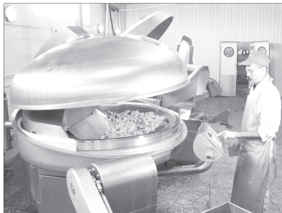
В таких огромных чанах готовят колбасную смесь, которая сначала отправится на формовку, а только потом - в термокамеру

- Проблем с запчастями пока не испытываем. Да, увеличились некоторые логистические моменты (то есть время доставки - прим. авт.), потому что поставщики, видимо, работают на привозном сырье, но сложностей нет, - отметил главный инженер. - Что касается колбасного цеха, то его оборудование мы получали от очень крупных импортеров, работающих по всей России. Они имеют огромный парк такой техники, большие складские запасы и мощности по расходникам. Сталкиваемся с тем, что получаем их гораздо дольше, чем раньше, приходится планировать загодя. Но сейчас многие рос-