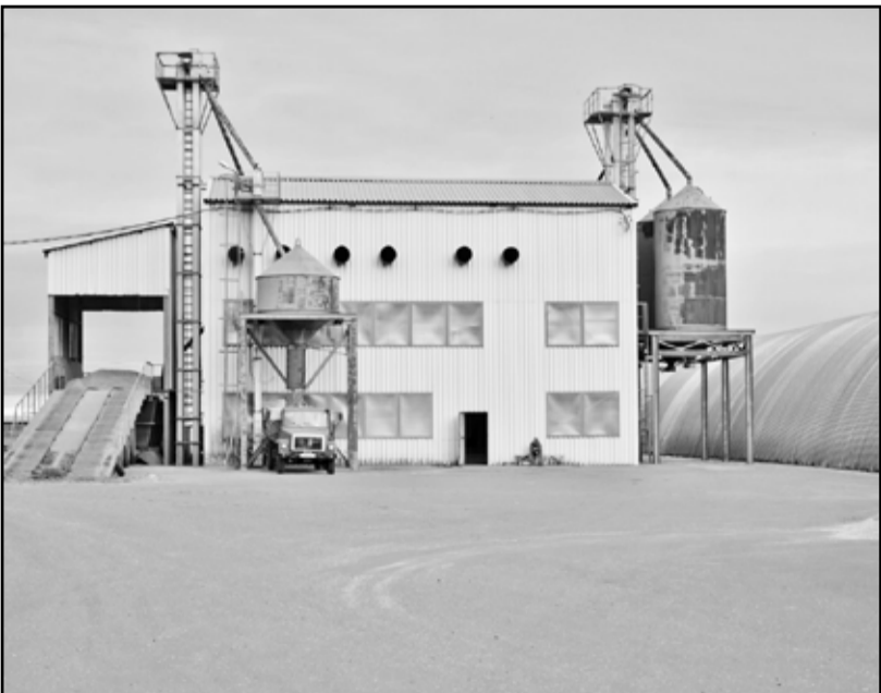
На полную мощность работает зерносушильный комплекс