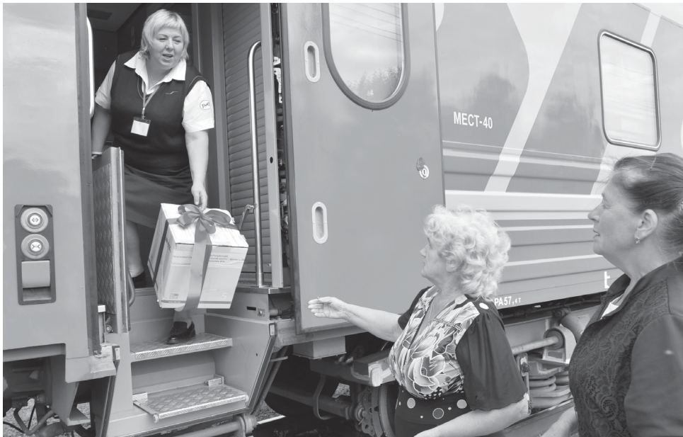
Подарок от руководства ко Дню железнодорожника

В начале августа отметили свой профессиональный праздник труженики стальных магистралей. В этот день по сложившейся традиции поздравления принимали люди, чьим выбором в профессии стал труд на железной дороге. Мы, члены Усть-Тавдинской ячейки Плехановской первичной ветеранской организации, навестили и поздравили ветеранов отрасли, вручили им цветы и открытки с пожеланиями счастья, добра и долголетия.