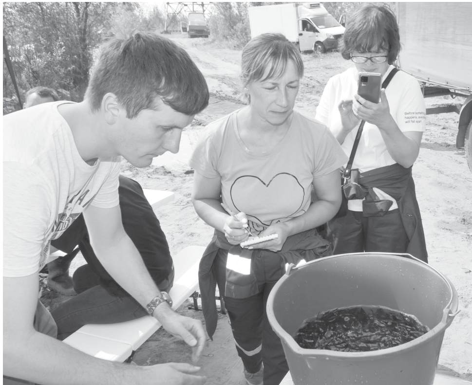
Очередная партия мальков стерляди готова к выпуску в Тобол