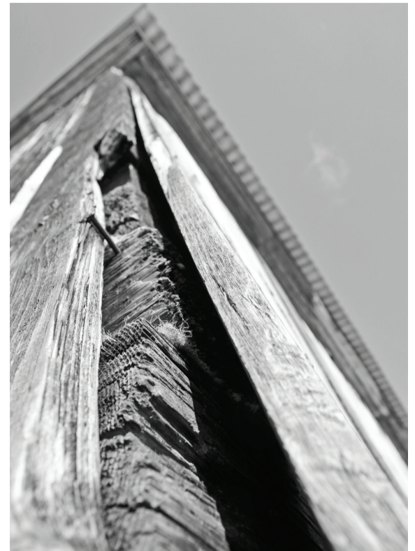
Брус, из которого сложен дом № 10, догнивает...

разваливается на глазах, гниёт. В любую квартиру зайдите – везде одна картина. А ведь здесь и молодые с детьми живут, и внуки у нас есть.