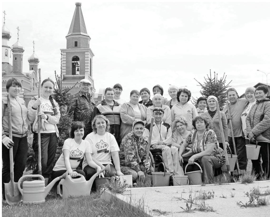
На работу как на праздник.

15 мая в акции «Лес Победы» приняли участие многие организации: районный совет ветеранов, управление Пенсионного фонда, АУ «Спорт и молодёжь», районный совет инвалидов – казалось, что участников было больше, чем саженцев! Зато отличного настроения хватило всем, ведь совсем неплохо после душных кабинетов насладиться солнышком, пообщаться с друзьями, а кому-то повезло даже посадить именное деревце. Скоро бумажные полоски с фамилиями будут заменены на таблички, а это означает, что только что посаженным «малышам» будет гарантирован полив, уход, их будут лю-