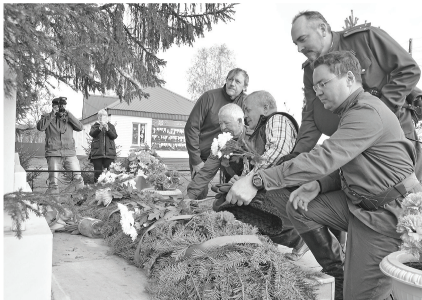
Торжественная церемония в Ключах.