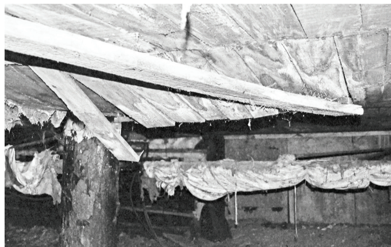
Подвал дома № 1, не зря жильцы первого этажа боятся провалиться на самое дно.