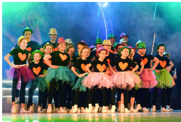
Ансамбль «Мы молодые» с ярким номером