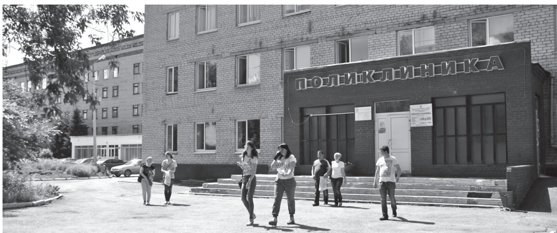
• Ремонт больницы не за горами. Реконструкция ждёт детское и инфекционное отделения. Скоро в модульное здание рядом с центральной больницей переедет стоматология. А за счёт её площадей увеличится детская поликлиника. На очереди ремонт хирургического корпуса.