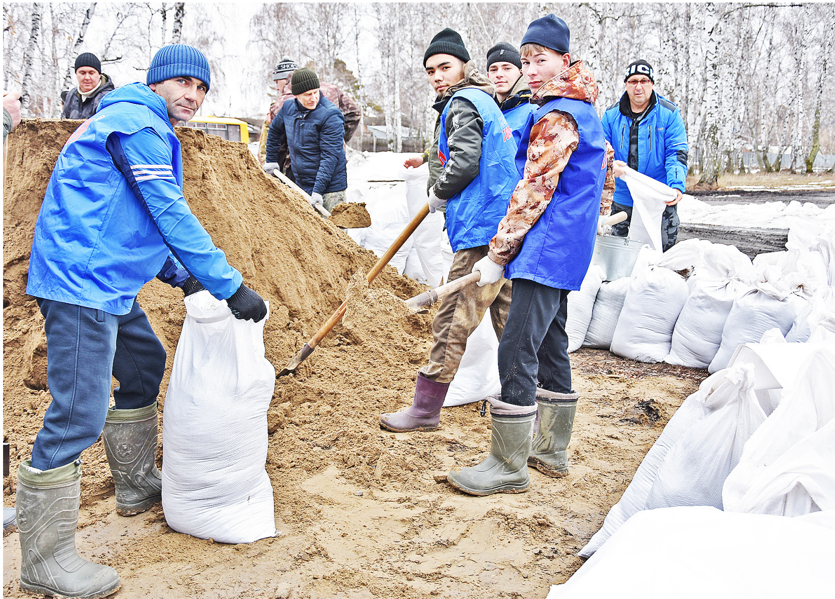
Местные жители и добровольцы надеются, что мешки с песком помогут защитить дамбу от повреждений

Десятого апреля волонтеры наполняли мешки песком, чтобы укрепить ими верхнюю часть дамб, находящихся рядом с улицей Советской и вдоль Совхозной