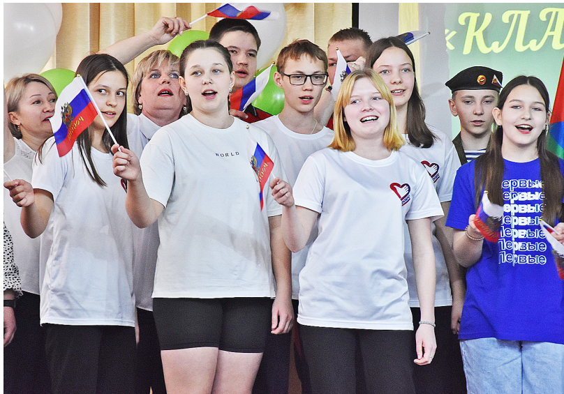
8 «А» класс Новоселёвской школы – победитель муниципального конкурса