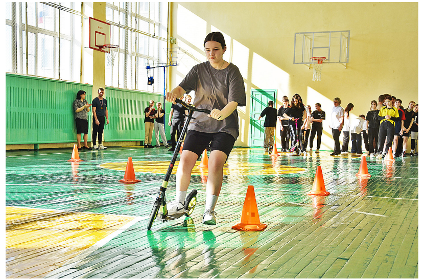
Самой весёлой и азартной была спортивная эстафета

«Умники и умницы» в номинации «Самый интеллектуальный класс» победу одержали учащиеся 8 «В» класса Казанской школы.