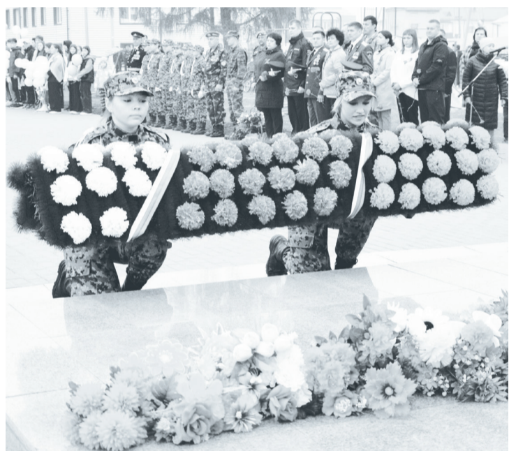
Традиционное возложение курсантами гирлянды к мемориалу.

Накануне Дня Победы жители с. Упорово участвовали во Всероссийских патриотических акциях.