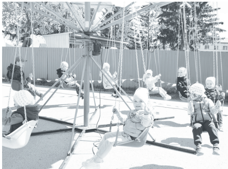
Детская площадка собрала много малышей.