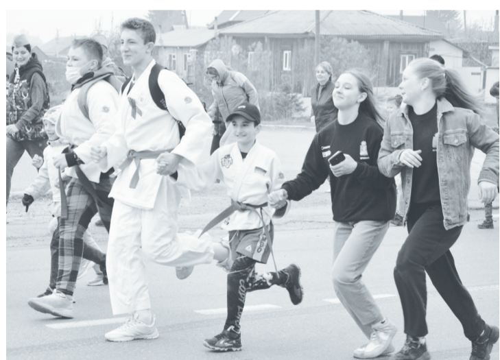
Забег стартовал от памятника героям-землякам.