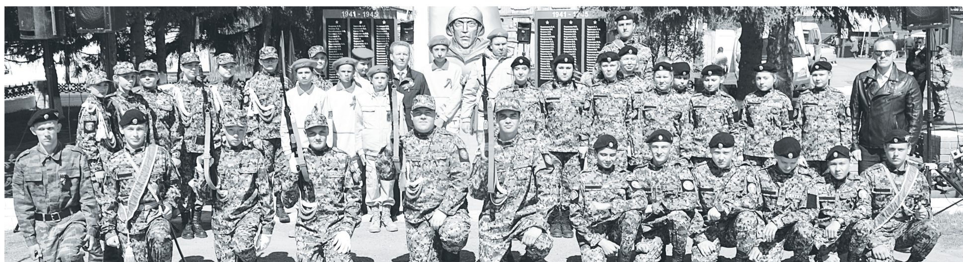
Юнармейцы и курсанты классов добровольной подготовки к военной службе всегда участвуют в праздничных мероприятиях.