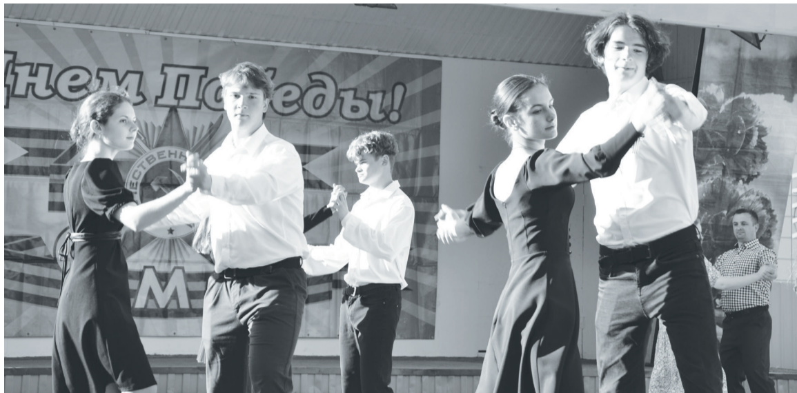
Старшеклассники Упоровской школы ежегодно участвуют в «Вальсе Победы».