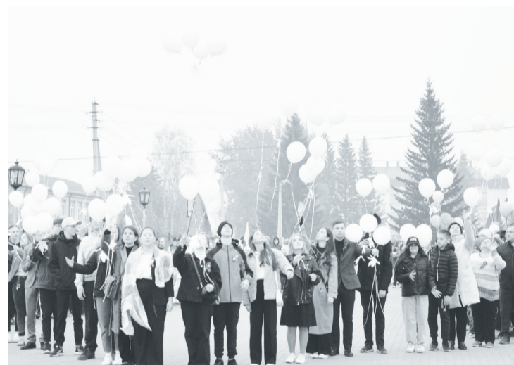
Из рук упоровских школьников взлетели в небо белые воздушные шары с бумажными журавликами.