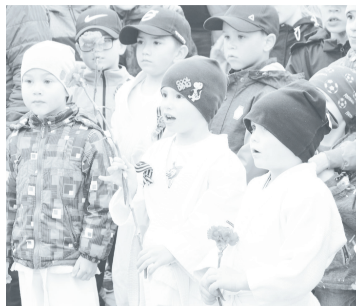
Юные дзюдоисты присоединились к всероссийским акциям памяти.