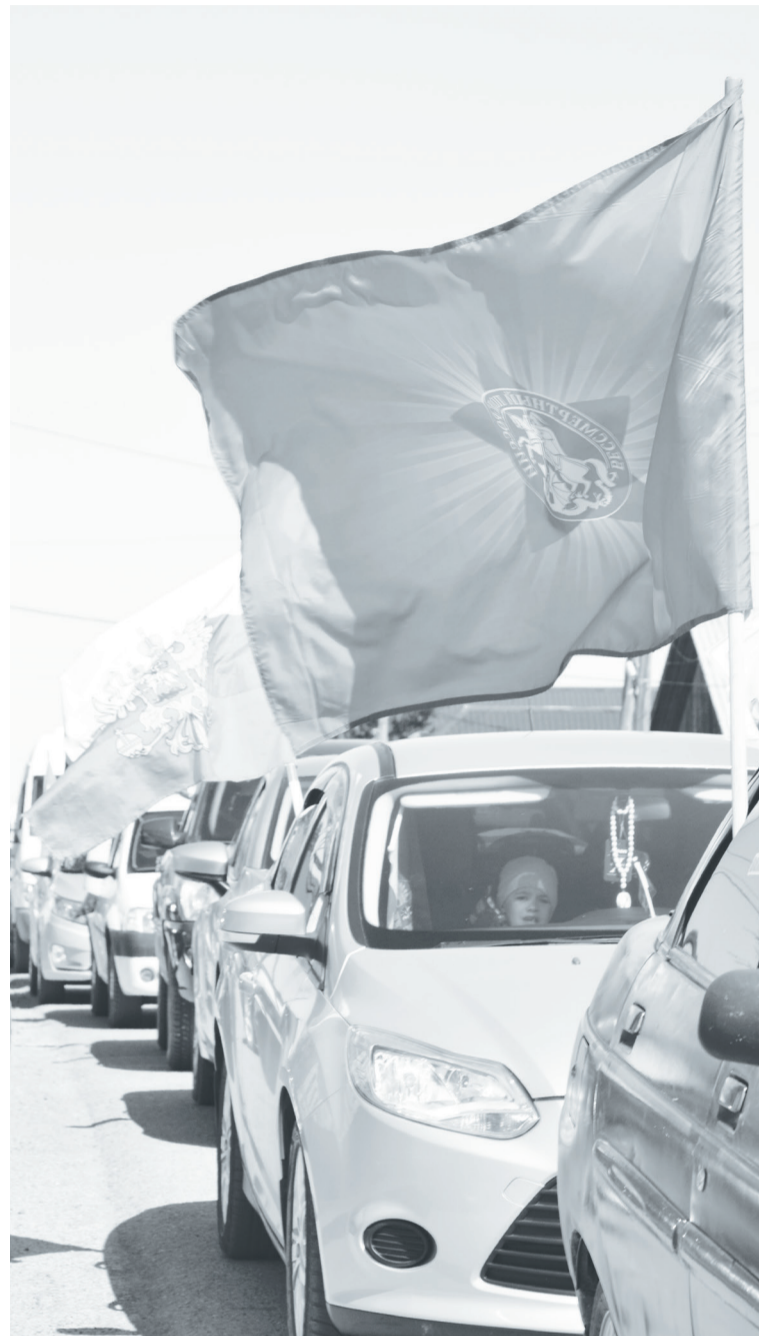
Колонна украшенных автомобилей района проехала по всем сельским поселениям района.