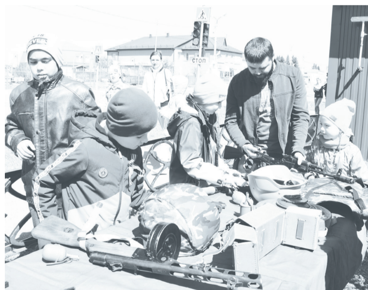
Местных мальчишек заинтересовала выставка оружия.

В промежутке между дневной и вечерней программами в зрительном зале Дома культуры состоялся спектакль-концерт «А память не стынет...», поставленный силами коллективов Упоровской школы, детского сада «Солнышко», школы искусств и Дома культуры. Сценарист и режиссёр представления — заслуженный учитель русского языка и ли-