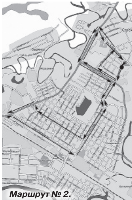
Маршрут № 2.

Движение по маршруту № 6 в районе микрорайона «Солнечный» в направлении областной больницы будет проходить по ул. Большая–Калинина–Карбышева–Паровозная–Большая и далее по маршруту. Движение в обратном направлении по аналогичной схеме. Для удобства горожан, ранее использовавших остановку «Дом ветеранов» для поездки на маршруте № 6 в центральную часть города, организована новая остановочная площадка «База «Транснефть» в районе дома № 173 по ул. Большая.