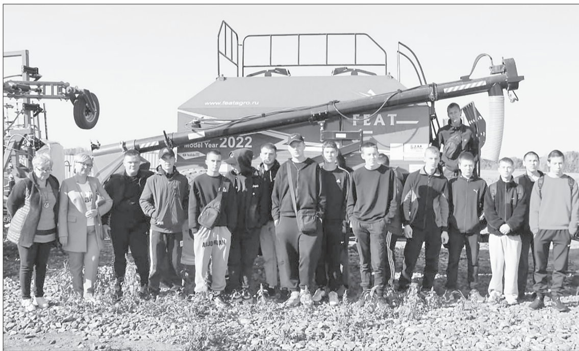
Студенты агроколледжа на практике.

Как агрохолдинг помогает будущим механизаторам