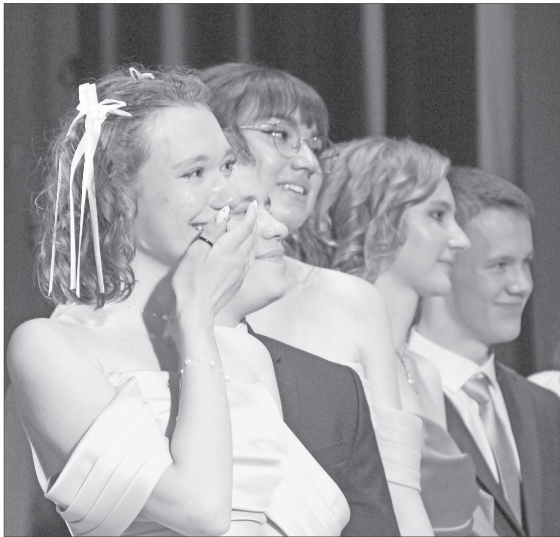
Без слёз не бывает выпускных балов – это слёзы радости и грусти, тревог и надежд – всего того, что переполняет юные души и обязательно находит свой выход.

К балу, как и полагается, готовились заранее – продумывали образы, подбирали музыкальное сопровождение, писали сценарии, готовили ответные слова – не только ребята, но и их родители. И, конечно, разучивали главный танец вечера – вальс. В праздничной обстановке 119 нижнетавдинских ребят получили аттестаты об образовании. Не обошлось и без признания заслуг самых усердных, эрудированных и талантливых, – в этом году в районе трое серебряных и девять золотых медалистов. Львиная доля из них – выпускники Нижнетавдинской школы: аттестаты