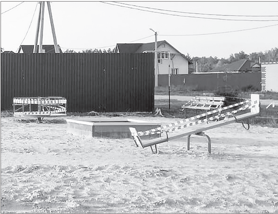
📷 Новая детская площадка появилась в западной части села Тюнёво.