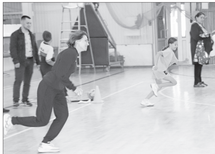
В спортивной поединке проигравших не было.