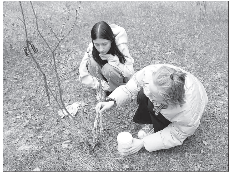
📷 На уборку территории выходят и взрослые, и подростки.