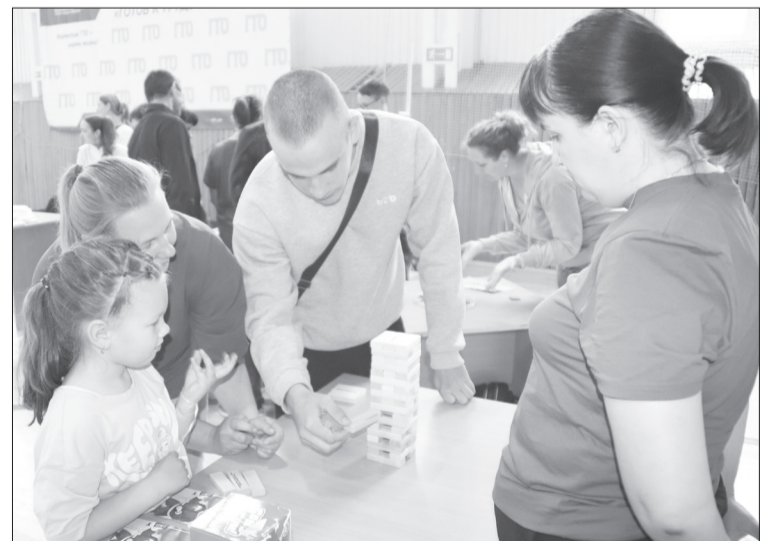
Аккуратность, терпение и внимательность в игре – главные правила.

Время пролетело незаметно, но даже за такой короткий период собравшиеся сдружились, сплотились, наобщались и повеселились.