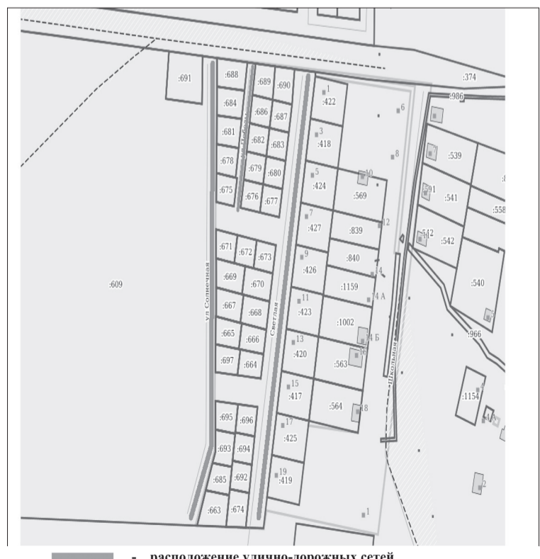
- расположение улично-дорожных сетей