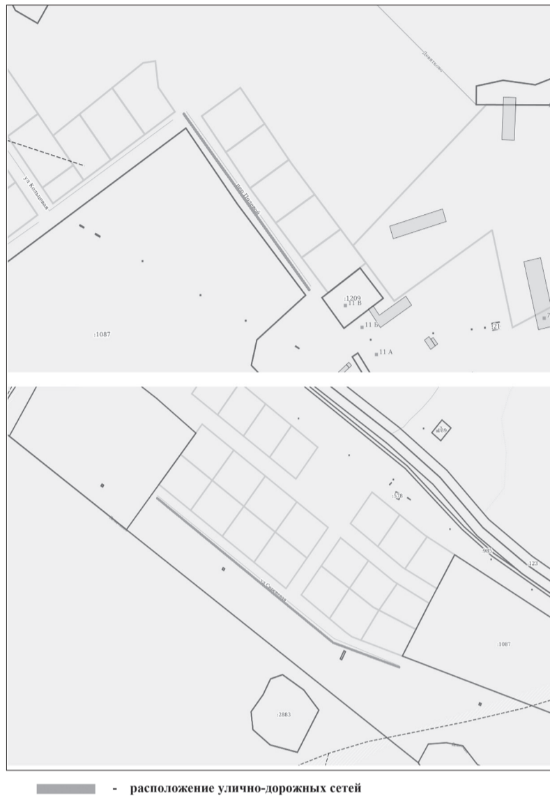
— расположение улично-дорожных сетей