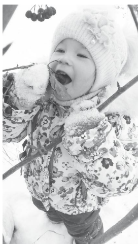
"Само очарование!" Вкус рябины.