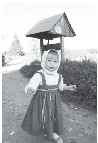
"Портрет на фоне лета" У колоды в лопаточках.