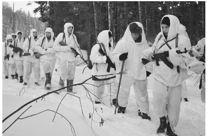
Реконструкция битвы под Москвой 1941 года.