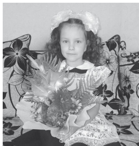
"Само очарование"