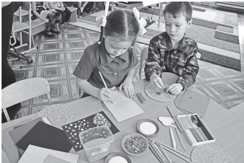
Участие в выполнении заданий квест-игр приняли и малыши

креченное донесение» и узнать, какое событие произошло 9 мая 1944 года. Обе команды с заданием успешно справились. В последующем, пройдя станции «Минное поле», «Медсанбат», «Оружие победы», родители узнали много интересного, а для кого-то и неизвестного. Например, сколько людей погибло в блокадном Ленинграде, даты начала и снятия