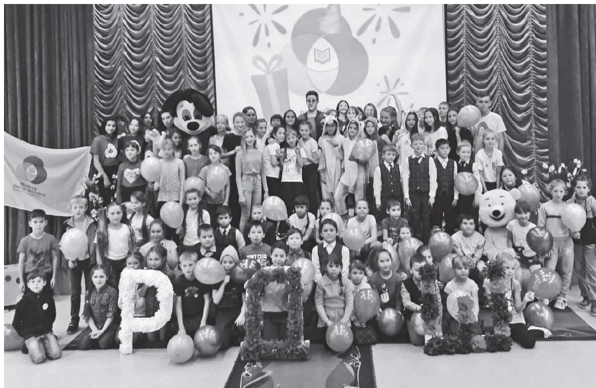
Первичное отделение РДШ Вагайской школы пополнилось новыми его именами

В их активе много полезных дел: акции «Маршрут безопасности», «Вежливый водитель», «Стань заметней», «Безопасный интернет», «Берегите лес от пожара», «День защиты дикой природы» и др. Становится традицией празднование Дня рождения РДШ (как когда-то «Республики «Мы»), посвящение учащихся в РДШ. В Год Памяти и Славы особую значимость обретает работа, связанная с сохранением памяти об участниках Великой Отечественной войны. Читательский марафон «Читаю о войне. За 75 дней до 75-летия», конкурс стихов о войне, театрализованная постановка к Дню Победы, День памяти о россиянах, исполнявших служебный долг за предела-