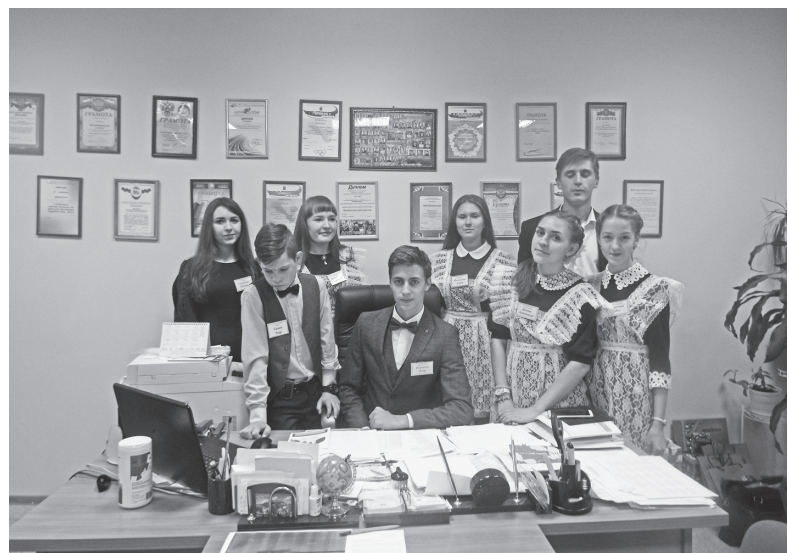
Орган ученического самоуправления – действенный помощник администрации и подколлектива Вагайской школы