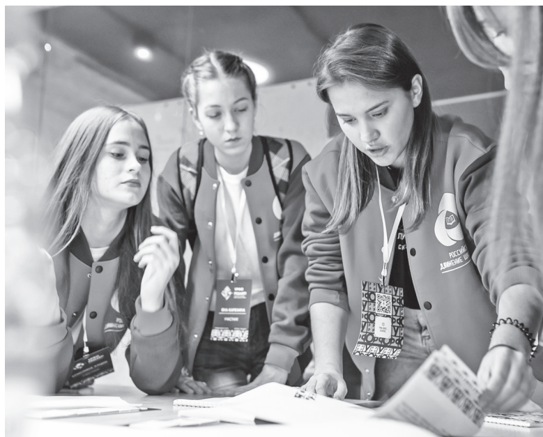
Идет подготовка к очередному мероприятию РДШ

прошли регистрацию, хотя и участвуют в мероприятиях РДШ школы, районного и регионального уровней, некоторые не прошли и образовательные курсы по программам РДШ на платформе так называемого «корпоративного университета». Несмотря на небольшой опыт работы в новых для нас условиях, в нашем активе уже достаточно много значимых мероприятий, проведенных в этом учебном году: школьный слет лидеров РДШ (октябрь 2019 г.), на котором речь шла о первоочередных задачах этого движения, в ноябре обсуждали проблему развития детского самоуправления в контексте реализации требований Положения о Российском движении школьников, приняли участие в Третьей региональной научно-практической конференции «Развитие детского обще-