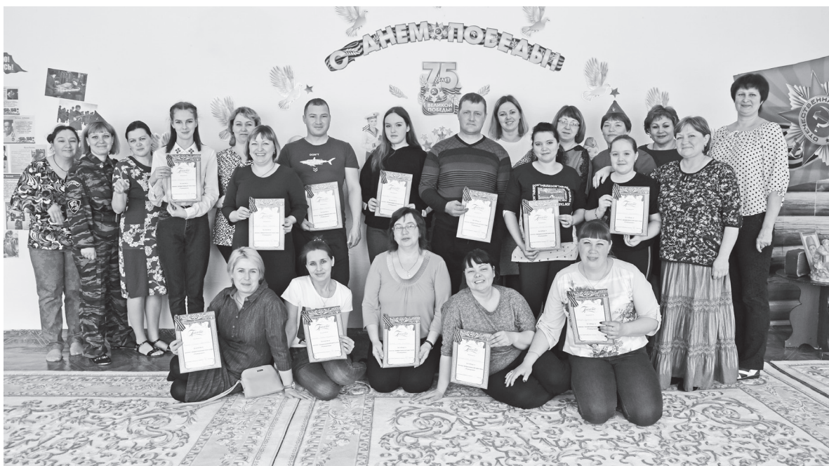
Участники интеллектуального состязания «По страницам истории нашей Победы»

Субботнее по-весеннему теплое утро 21 марта собрало родителей детского сада «Колосок» на увлекательную квест-игру «По страницам истории нашей Победы», посвященную Году Памяти и Славы.