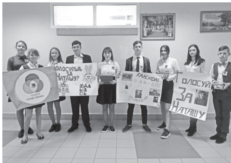
В Вагайской школе идет предвыборная кампания