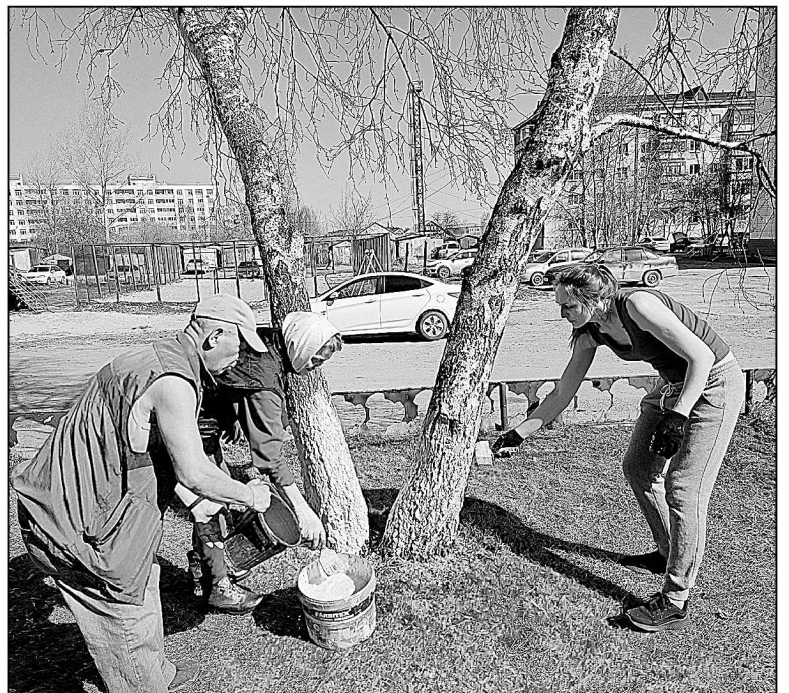
На субботник вышли жители Винзелей.