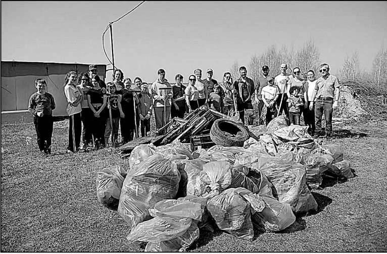
Берега озера Андреевское станут чище.