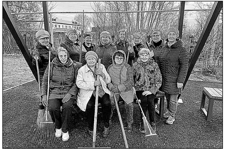
Ветераны Червишево – в первых рядах. «Поработали – теперь можно и отдохнуть».