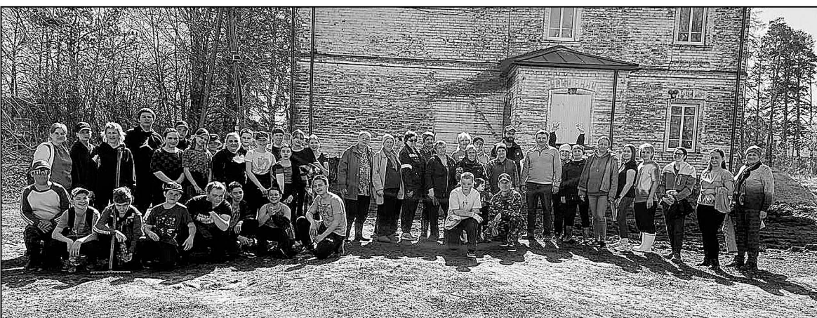
Территория Чукмалдинского парка – предмет особой заботы жителей Кулаково.