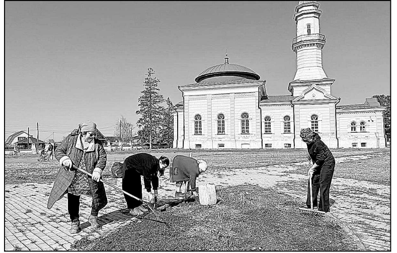
Возле Ембаевской мечети полный порядок.