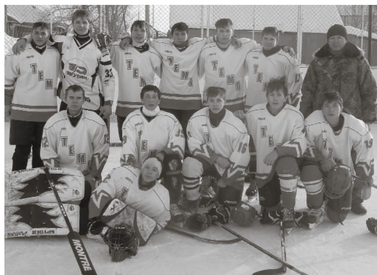
* Наши юные победители