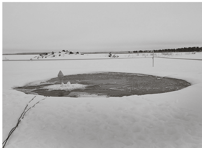
* Современный аэратор