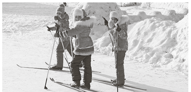
* Вечером красиво, днём весело