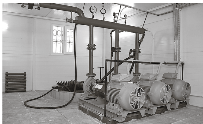
* Проводятся масштабные работы для очистки воды