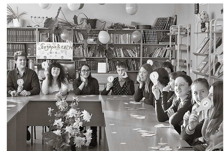
* Было интересно!

Светлана КОЖИНА, МО «Молодёжный портал»