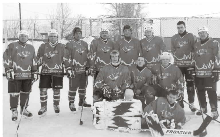
* Взрослая команда «Темпа»

В прошедшую субботу хоккейные команды Сладковского района (юноши и взрослые) успешно провели первые игры в наступившем году. Встречи состоялись на выезде, сборные играли в селе Большое Сорokino.