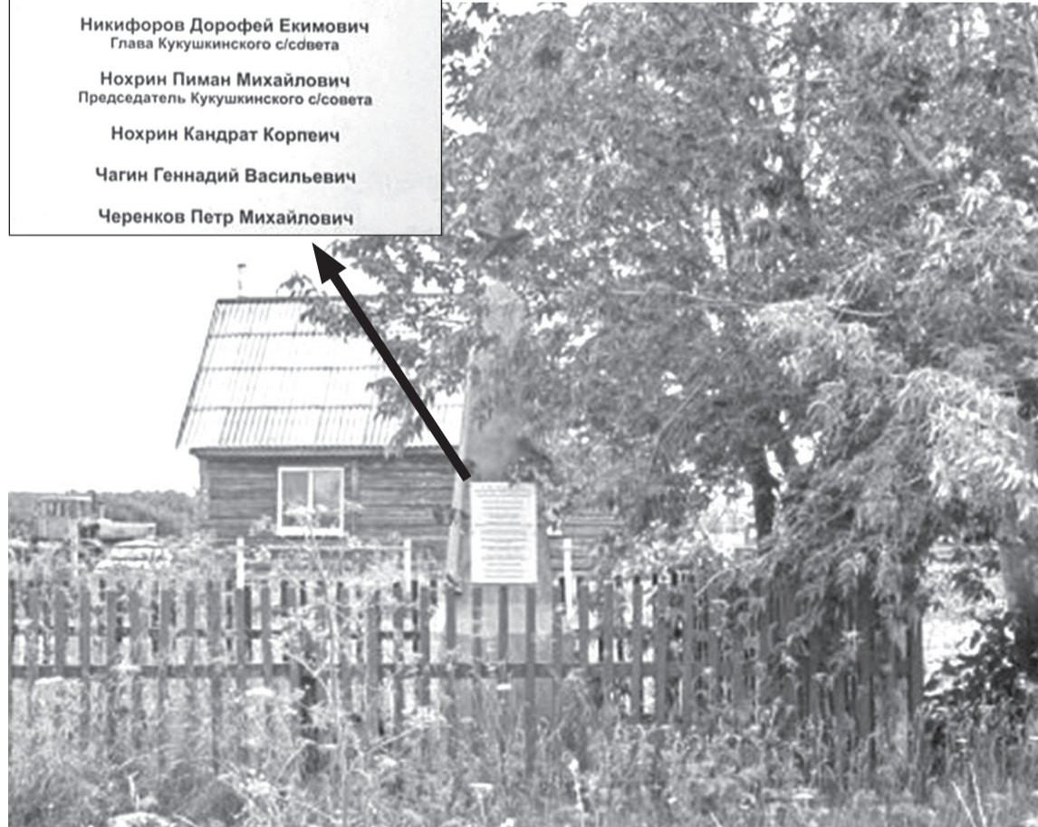
Братская могила находится на въезде в село Кукушки. В ней похоронены защитники советской власти, которых убили во время крестьянского восстания 1921 года