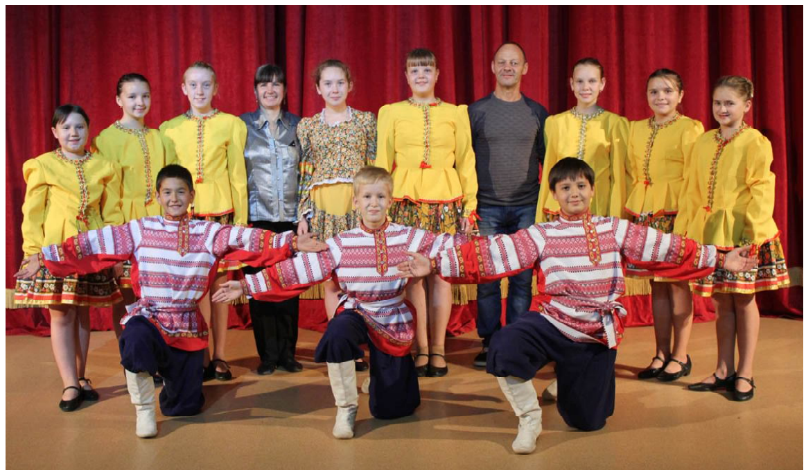
Подготовительная группа ансамбля «Русичи» - «Калинка»