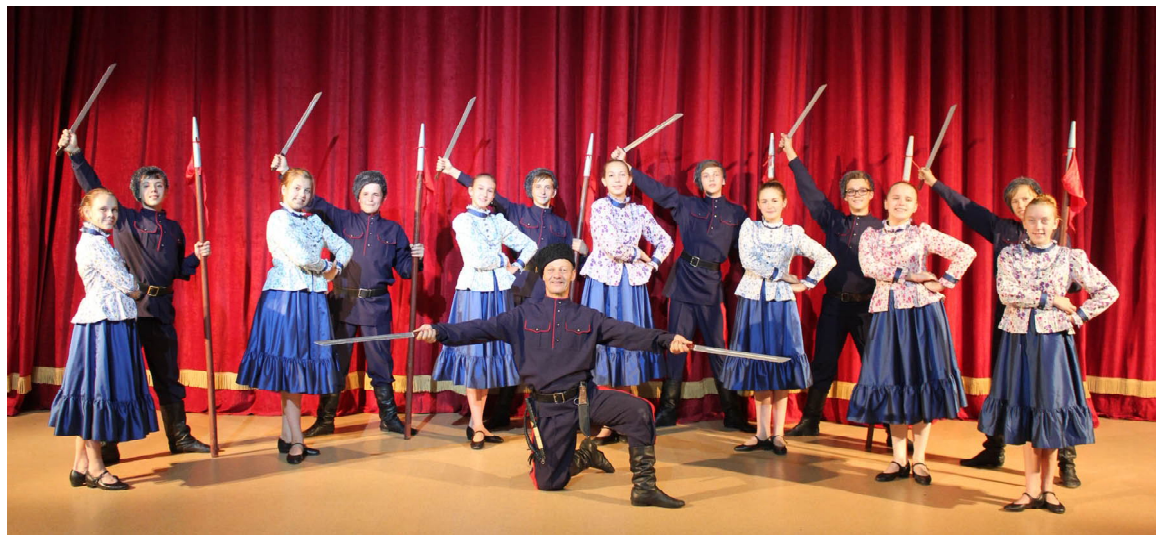
Танцевальный коллектив «Казачья вольница»