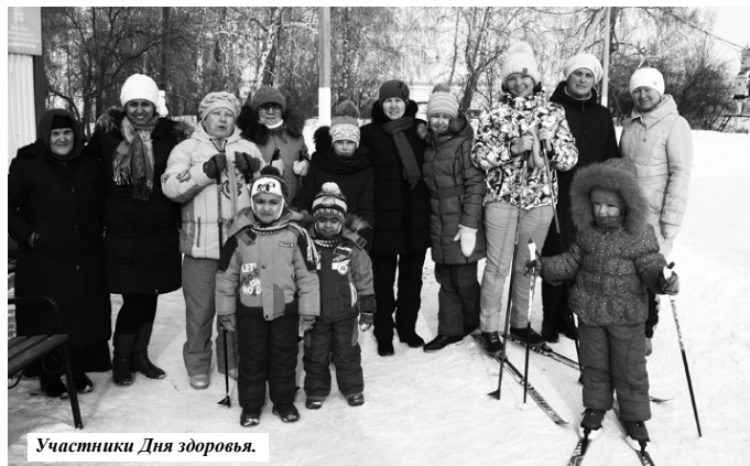
Участники Дня здоровья.