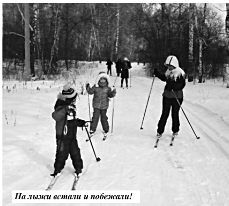
На лыжи встали и побежали!