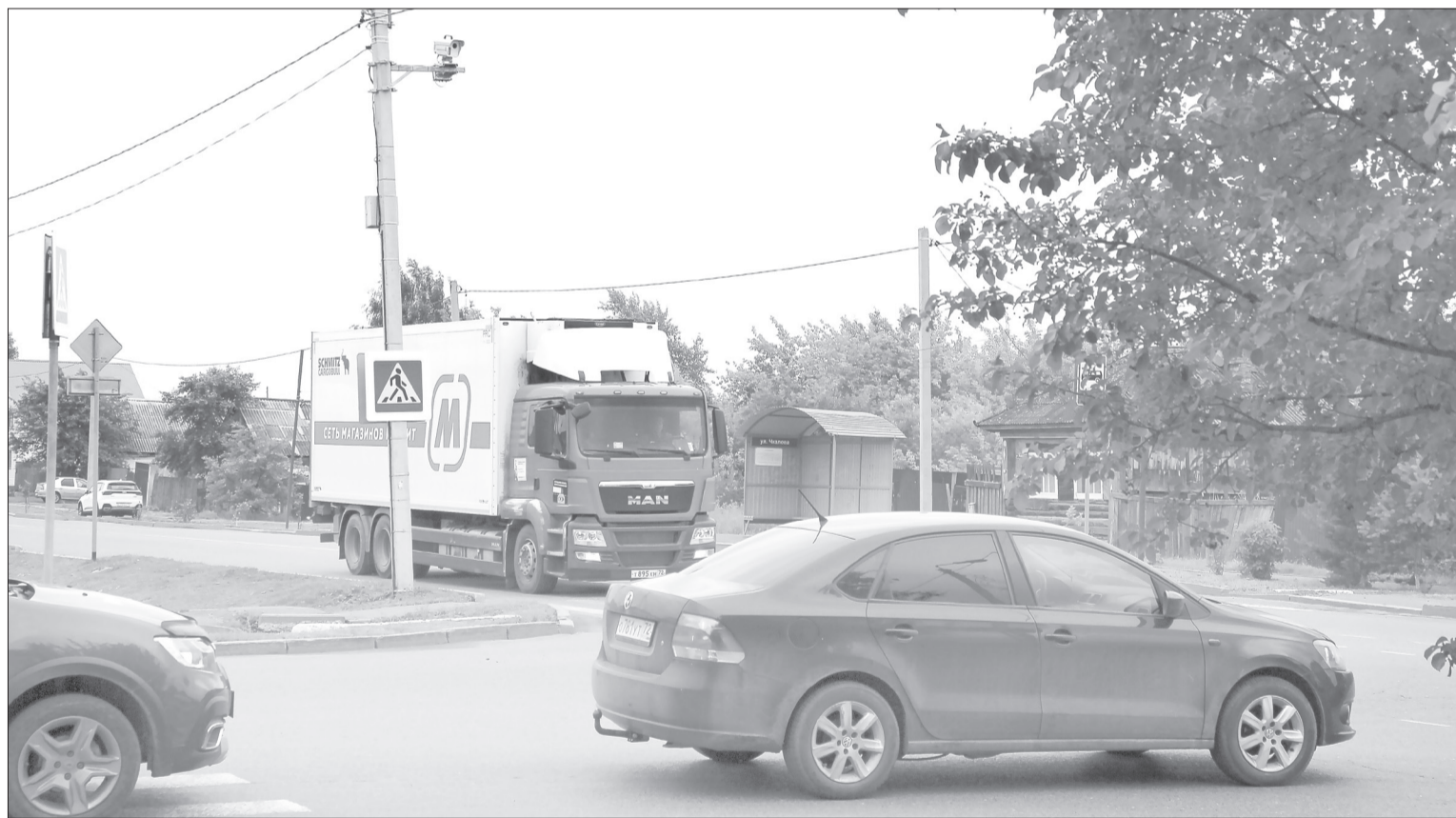
Камера установлена на перекрёстке улиц Ишимской и Чкалова. Он сейчас стал одним из самых оживлённых в городе

В Ялуторовске установили стационарные камеры фиксации дорожных нарушений