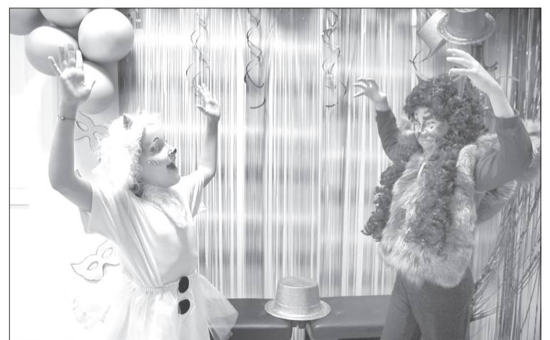
Перед выходом на сцену юные актёры Киёвской детской школы искусств вживаются в роль