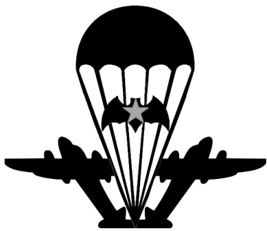
Проект памятника ВДВ «Никто, кроме нас»

Совет ветеранов спецназа и разведки Тюменской области и ветераны ВДВ Казанского района при содействии администрации Казанского муниципального района выходят с инициативой об установлении памятника «крылатой пехоте» в центральном парке села Казанского.