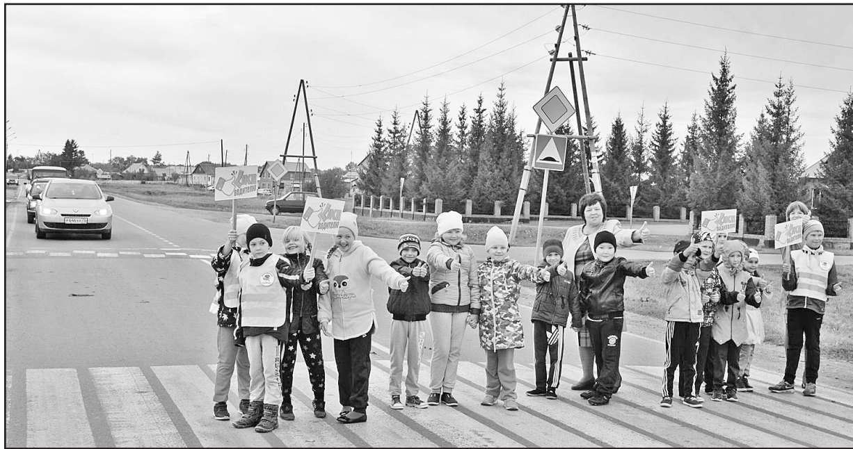
На пешеходном переходе дети должны чувствовать себя в безопасности

В рамках профилактического мероприятия «Внимание – дети!», которое проводилось на территории Тюменской области с 22 августа по 18 сентября, учащиеся 2 класса Новоселенёвской школы совместно с сотрудниками ГИБДД на центральных улицах своего посёлка провели акцию «Лайк» – водителю!».