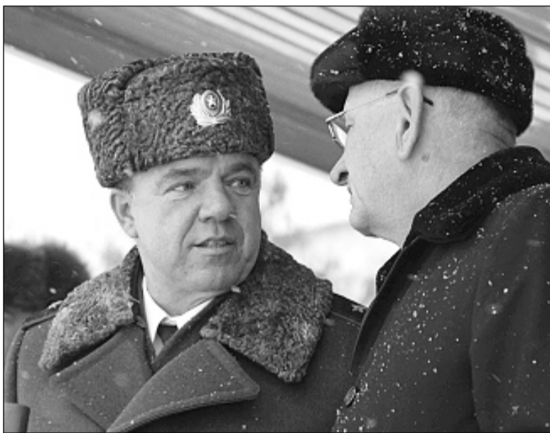
У генерала-лейтенанта Александра Журавлёва – богатый опыт боевых операций