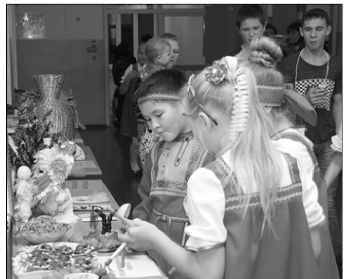
На выставке своё мастерство представили около пятидесяти семей