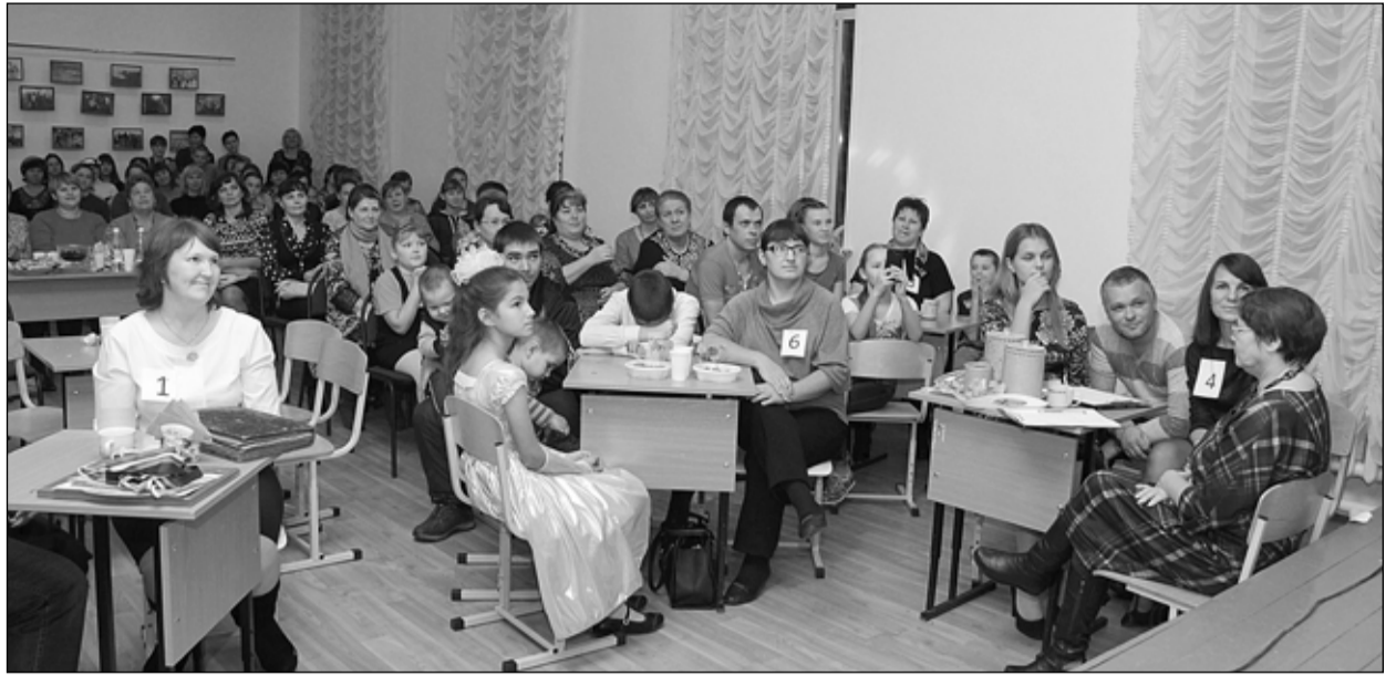
Настоящий семейный праздник получился в школе № 4

Евгения ПЕТЕЛИНА, с. Малышенка. Фото предоставлено автором.