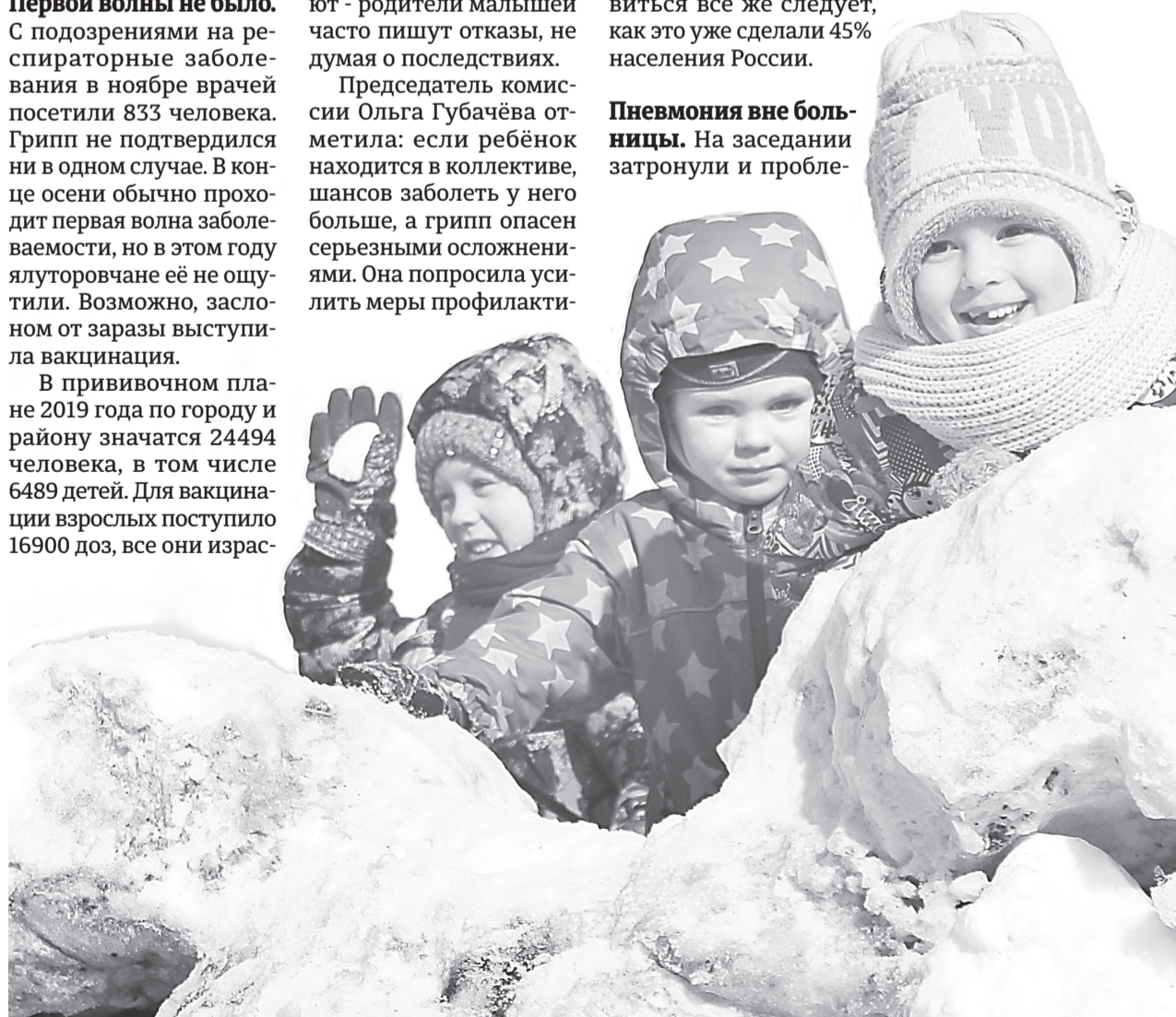
Играть в снежки веселее, чем болеть, особенно когда декабрь радует тёплой погодой