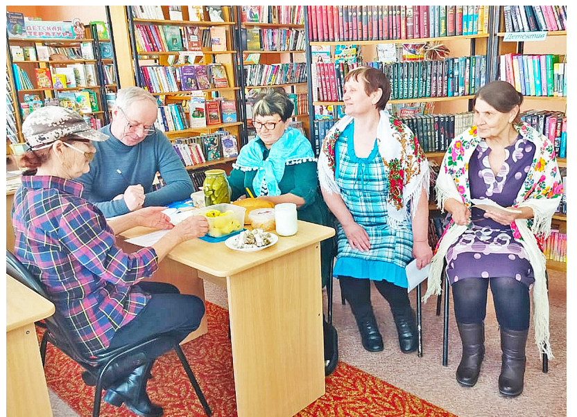
Встреча прошла в тёплой дружественной атмосфере