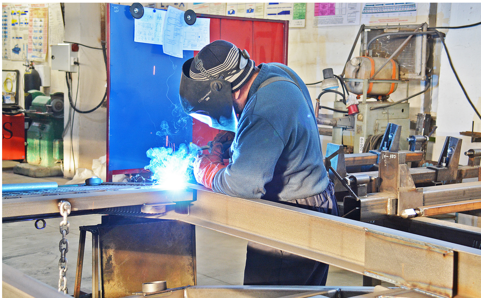
В обществе с ограниченной ответственностью «Авагро» не только выпускают новые агрегаты, но и ремонтируют технику

питание, сервисные услуги и так далее. Среди них – организация цеха по изготовлению полиэтиленовых ёмкостей сельскохозяйственного назначения, инвестором является ООО «АВАГРО».