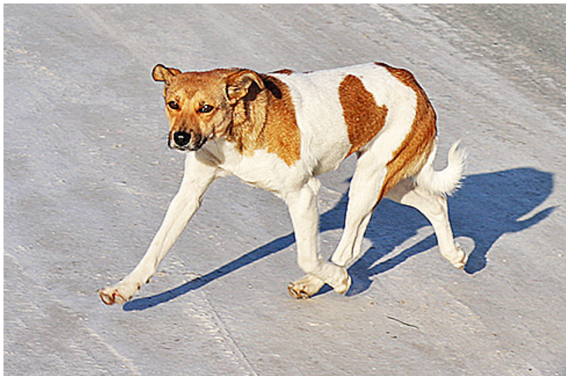
У каждого домашнего животного должен быть хозяин