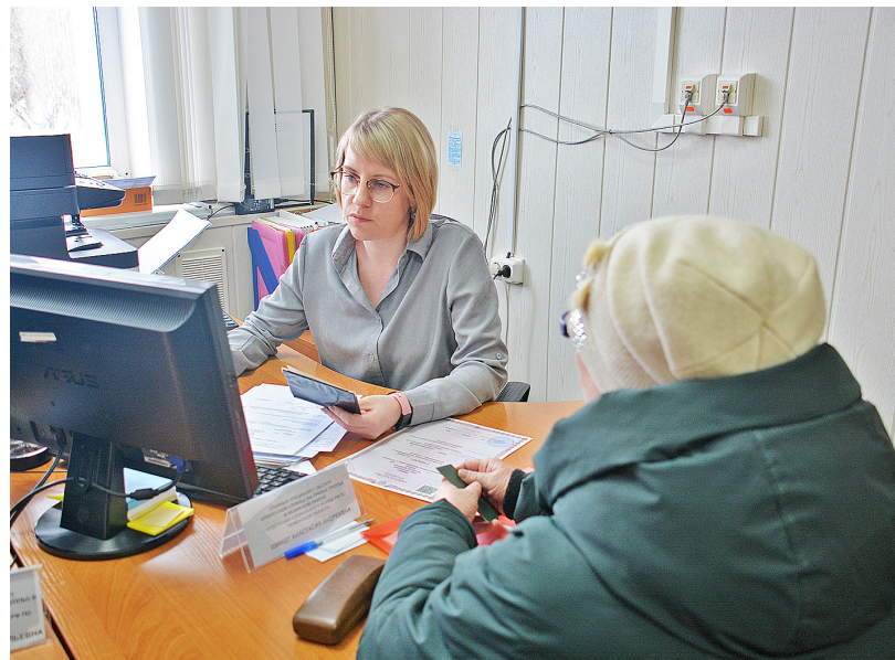
На приёме в отделении Социального фонда в Казанском районе

— Длительное время работа по гражданско-правовому договору была не так привлекательна для квалифицированных работников из-за отсутствия социальных мер поддержки, например, пособий по временной нетрудоспособности и оплачиваемого отпуска по уходу за ребёнком. Это происходило потому, что на гражданско-правовые договоры распространялось только пенсионное и медицинское страхование, а обязательное социальное — нет. При этом работодатели удобно нанимать сотрудников