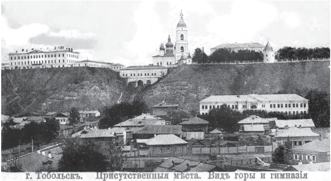
г. Тобольск. Присутственные мѣста. Видъ горы и гимназія

Журнал широко знакомил тобольяков с оригинальными сочинениями своих авторов. Это были преимущественно поэтические жанры (поэма, ода, послание, стихотворная сказка, басня). Большинство публиковавшихся произведений, в соответствии с просветительскими задачами издания, имели сатирический характер, т.е. обличали пороки. Порой это обличение носило социальный характер. Таковой была