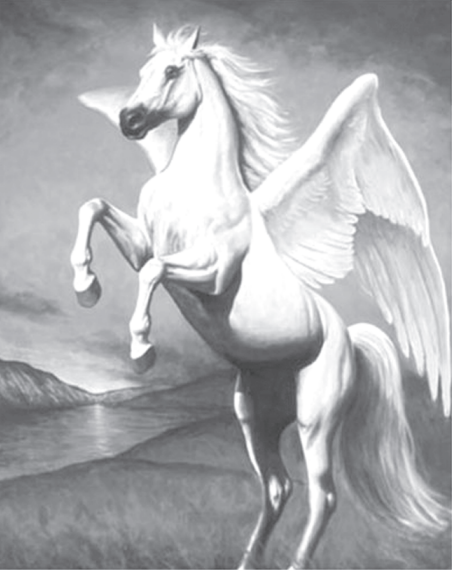
Пегас на Геликоне

Чтобы не пропал их труд и само уникальное издание, листать его необходимо в специальных «библиотечных» перчатках. Под их матерчатыми пальцами – страницы майского, например, 1791 года, журнала. «Ежемесячного сочинения, издаваемого от Тобольского главного народного училища». Именно в этом учебном заведении возникла идея создания «Иртыша...». Мысль молодых учителей поддержало руководство училища, а также, не поверите, губернский прокурор, поэт и «волтерист»