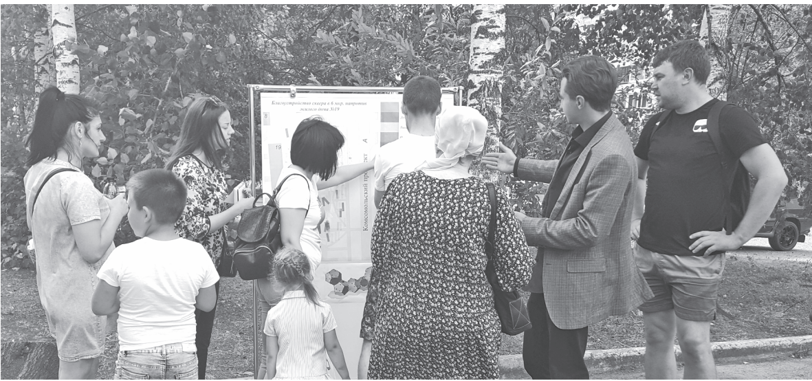
Идеи горожан включают в концепцию скверов

Подведены итоги общественных обсуждений по концепции будущих скверов на улице Ремезова (площадка у Спасской церкви и иконописной школы) и в 6 микрорайоне у дома №19 (недалеко от площади Менделеева).