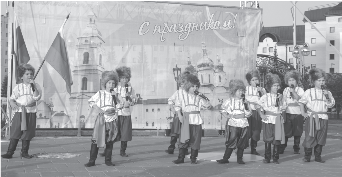
На празднике слово дали артистам

– Дорогие тоболяки, наша страна отмечает День Государственного флага – символа государства, объединяющего всех нас, позволяющего чувствовать себя гражданами одной большой страны. Мы гордимся нашей страной, нашим флагом. Желаю вашим семьям