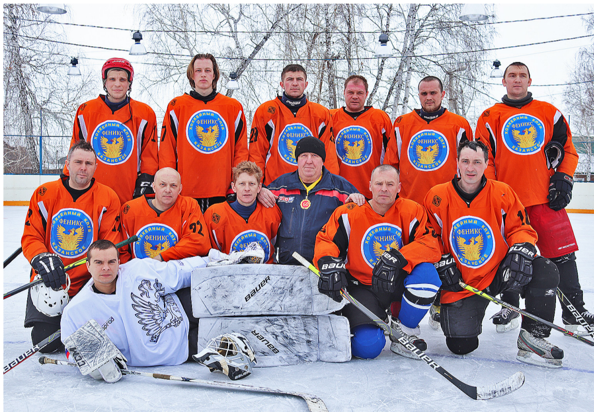
Впереди у казанской команды – две ответственные игры

На хоккейном корте в Казанском 4 февраля состоялся матч между местной командой «Феникс» и дружиной из Абатского района в рамках чемпионата Тюменской области по хоккею с шайбой среди любительских команд в подгруппе «Юг».