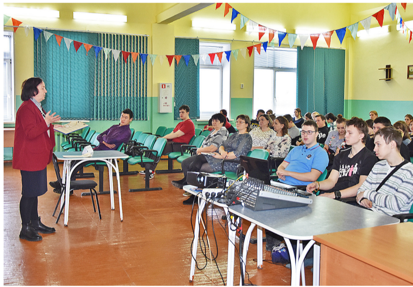
Интересно и познавательно прошёл исторический урок для учащихся техникума