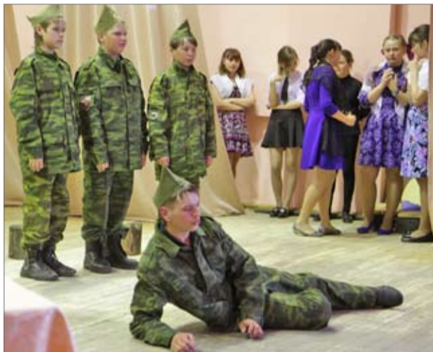
Сцена из спектакля «Пастух и пастушка»

Темы жестокой войны, народного подвига стали главными в выступлениях коллективов. Каждый выход на сцену можно было назвать самобытной постановкой, где ощущалось авторское «я», творческий замысел, оригинальность исполнения. Сценическое и музыкальное оформление, удачное мультимедийное решение, костюмы, а главное искрящиеся глаза юных